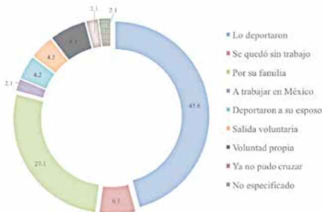
Gráfica 2. Motivos del retorno de la población en comunidades de Coatepec Harinas y Tenancingo, Estado de México, 2017