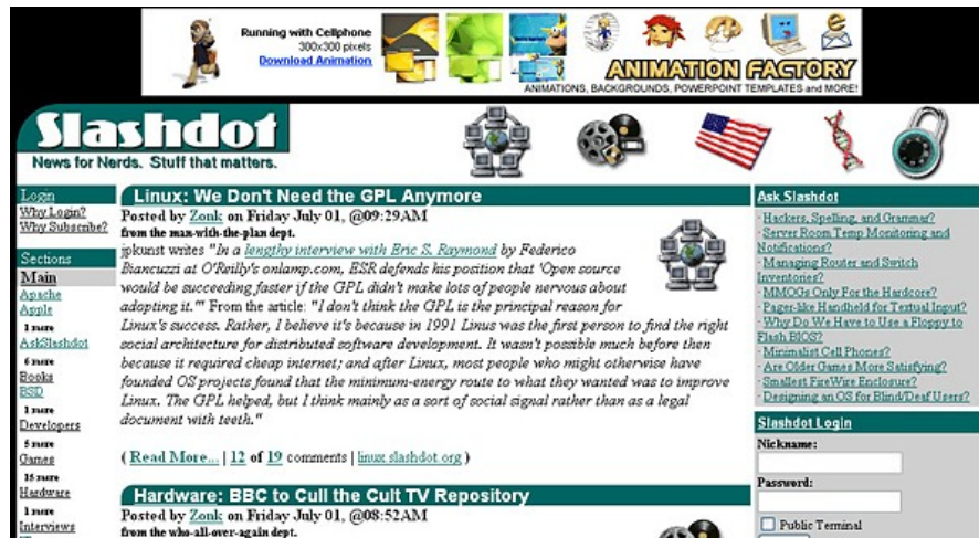
Figura 2 – Página inicial do site do Slashdot

Também, pode-se dizer que Slashdot ( http://slashdot.org ), um grande fórum de discussão na Internet, criado por Rob Malda é inspirado na ética hacker. Em resposta para a entrevista realizada pela autora, ele fala em ter criado um espaço onde as pessoas poderiam discutir coisas que lhes interessavam. E o que a ele interessa é “Linux, Open Source, Freedom of Speech, Freedom of Information, Technology, Gadgets, Toys, Video Games” (MALDA, 2005). Slashdot possui, ainda hoje em dia, um dos modelos de colaboração e moderação de notícias e comentários mais apurados da Internet. A estrutura está baseada em pontos, karmas e, dependendo dessa pontuação, um usuário pode ter ou não a função de moderador. A própria comunidade que se auto administra, como no caso do desenvolvimento do software livre, nesse caso a estrutura está aplicada a notícias.