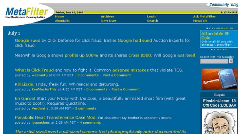
Figura 4 – Página inicial do site do Metafilter