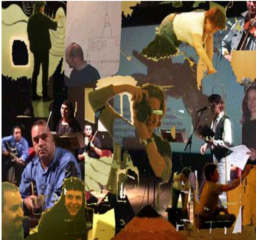
Figura 04. Imagem do Cartaz de Alternativa 1- 'Intervenção Em Portugal: Terra Sem Fronteiras'