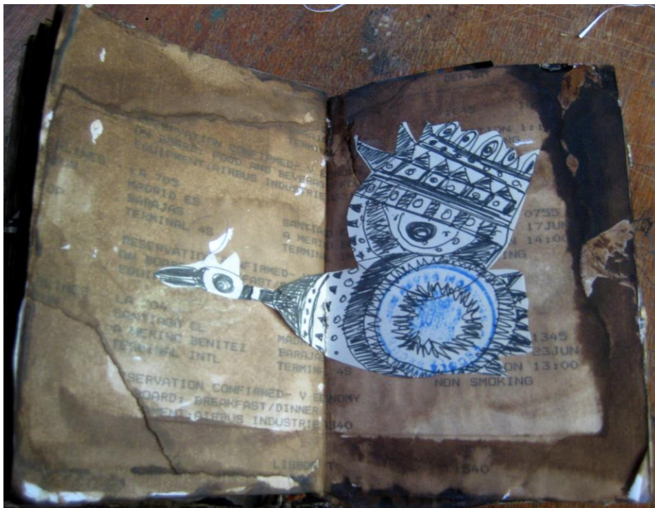
Figura 01. Caderno de viagem, junho, 2007.

Piénsate hoy como formador/ educador que eres para observar las conexiones entre tu comienzo y lo que te gustaría llegar a ser. Dibuja tu silueta para charlar con el curso de tu vida de enseñanza y aprendizaje. Deja espacios para localizar sucesos positivos hacia fuera de la línea y negativos hacia dentro de ella. Coloca círculos, señales, para escribir esas palabras. Céntrate en las articulaciones, puntos curvos, momentos memorables, o marque sucesos en tu desarrollo (AGRA PARDINAS, 2010, p. 27).