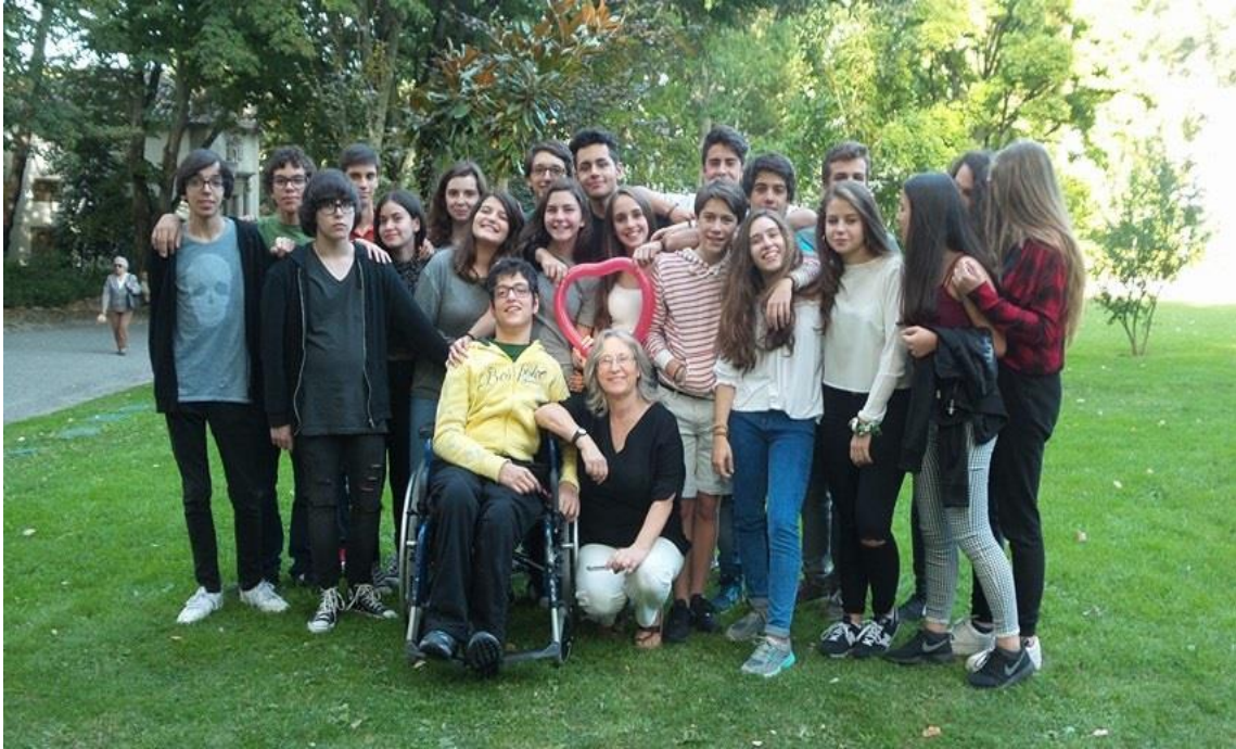
Figura 02. A classe de 2017-2018.

Mas será que eu faço isso? Carrego comigo uma tradição modernista do ponto, linha, luz, cor, perspectiva, forma-função, comunicação visual, de técnica e de forma que está confortável nesta escola apática e acrítica. E carrego comigo uma força tremenda através da arte comunitária, que passa pelo respeito pelas narrativas, pelas conversas sobre identidades e culturas num clima caótico de constante negociação entre mim e meus alunos. E esses fardos podem pesar toneladas!