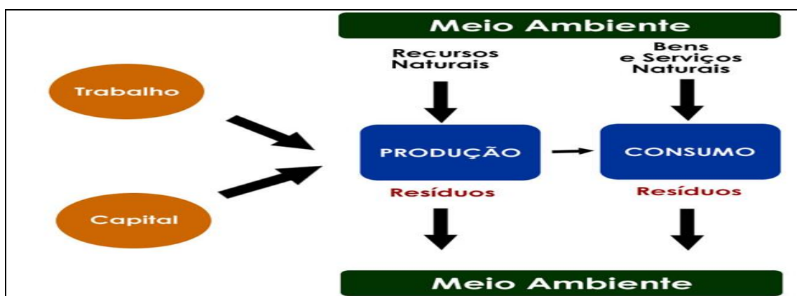
Figura 1 – Circuito Econômico Ampliado