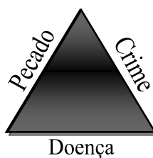
Figura 1: Triângulo Conceitual Pecado-Crime-Doença

Este paradigma da ciência, da lógica objetiva, da política e da religião dá base ao que Berger e Luckman (2006) definem como reificação . Os autores explicam que o processo de reificação é a tomada dos fenômenos, ou atividades humanas, como se fossem fatos da natureza, resultados de leis naturais ou até mesmo divinas. Desta forma, implica a própria capacidade do esquecimento da autoria perante o mundo humano. Ou seja, da perda não-consciente da constante dialética entre o homem, produtor, e seus produtos. É ignorar que existe um retorno intersubjetivo, onde produto gera o discurso do produtor e o (re)subjetiva, tornando-o sujeito deste discurso.