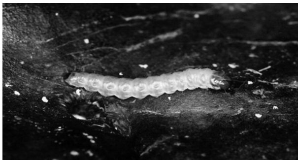
FIGURA 1: Lagarta de Cryptophlebia carpophagoides coletada em frutos de timbaúva, Santa Maria, RS, Brasil, 2004.

Foi identificada a espécie Cryptophlebia carpophagoides (Lepidoptera: Olethreutidae) nos frutos coletados no campus da Universidade Federal de Santa Maria, estado do Rio Grande do Sul, Brasil. Nas Figuras 1, 2 e 3, seguem-se os diferentes estádios de desenvolvimento do inseto, de lagarta, pupa e adulto nesses frutos.