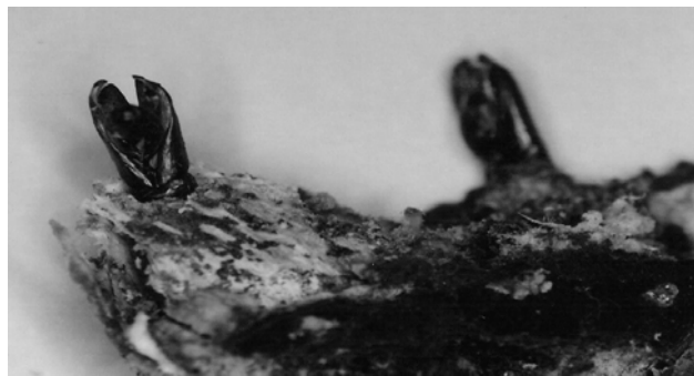
FIGURA 2: Exúvia da pupa coletada em frutos de timbaúva, Santa Maria, RS, Brasil, 2004.