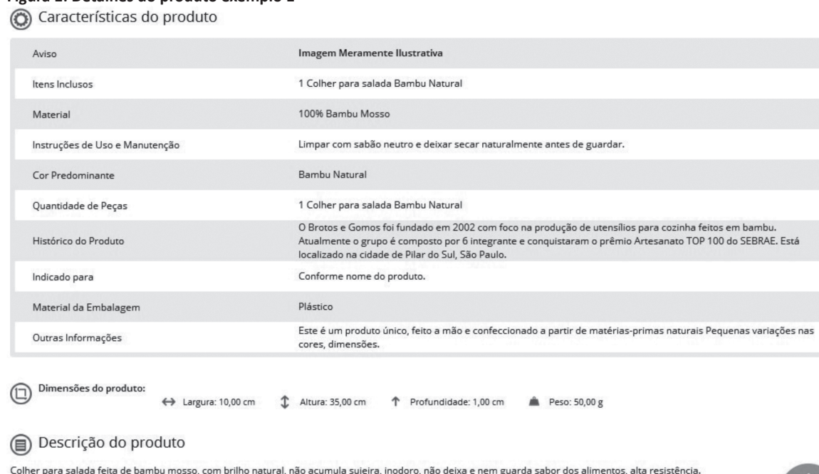
Figura 1: Detalhes do produto exemplo 1

Uma característica inovadora nos produtos da linha E-Solidário é a inclusão da descrição “Histórico do Produto” nos detalhes do produto, suprimindo o interesse emergente dos consumidores nos bastidores da produção dos bens a serem comprados (Töpfer, 2002). Nas imagens a seguir, constam exemplos dessa inovação na descrição de produto. A Figura 1 reproduz todas as descrições que constam na descrição do produto tomado como exemplo.