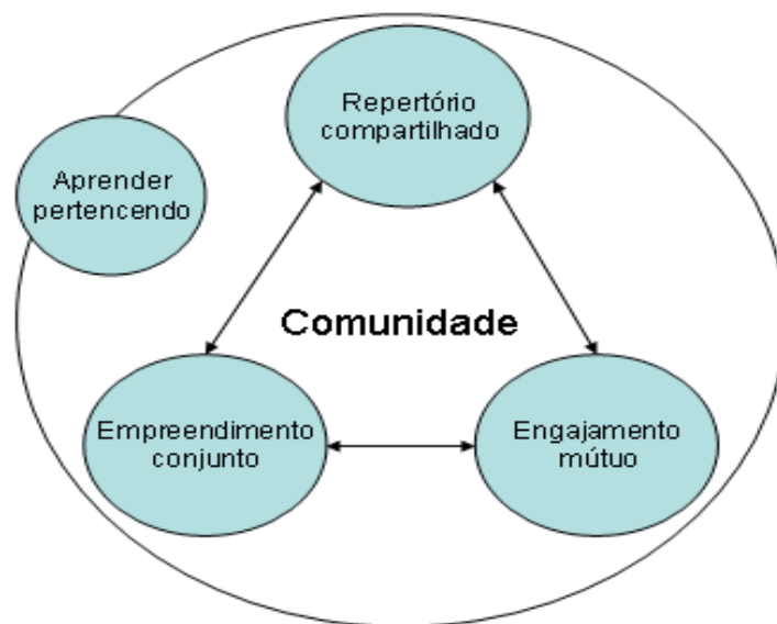
Figura 1: Dimensões de uma comunidade de prática.

Para ser evidenciada a existência de uma comunidade de prática, esta deve contar como o resultado da inter-relação de três dimensões: empreendimento conjunto (comum aos seus membros), baseado na negociação de significados, da responsabilidade mútua e da participação sem necessidade de homogeneidade; engajamento mútuo , que denota as conexões entre os seus membros, pela realização de tarefas em conjunto, pela complexidade e diversidade social de seus membros e pelo esforço de manutenção do grupo; e aquilo que ela produz representado por um repertório compartilhado , como histórias, objetos, artefatos, ações, conceitos e tudo o que é construído pela comunidade que pode possuir significado apenas quando contextualizado nela (Nicolini, 2007). A Figura 1 mostra a relação entre essas dimensões: