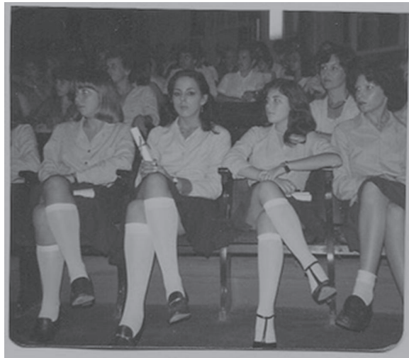
«Percebeu menina formando 2º Grau na Escola, menina roupa antiga»