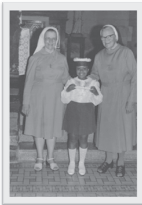
«A menina entre as freiras da escola, em trajes de formatura»

«Uma sorri, a outra observa. Cada uma olha para um lado. Dupla, oposta, igual, diferente. A da direita e a da esquerda, as duas de fralda, o cacho no alto da cabeça se repete na tentativa de tornar igual. A linha tênue do sofá separa uma da outra». As vidas quase imperceptíveis, que escapam das vidas docentes, ganham novos contornos nas narrativas visuais, “o punctum é o que é acrescentado à foto e que todavia já está lá” (BARTHES, 1984, p. 85).