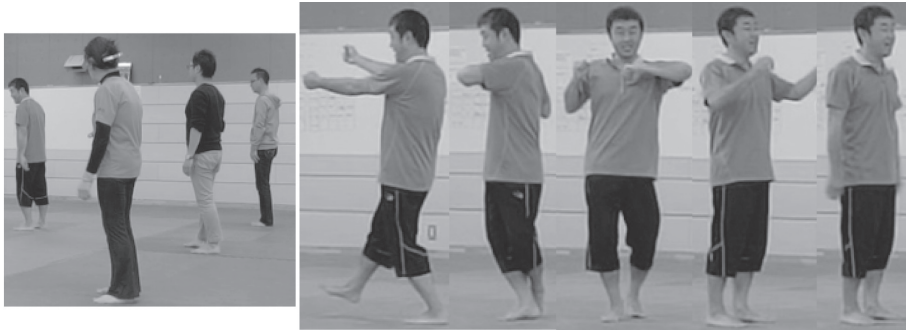
図6 男性のインストラクターによる打ち込み練習の導入

(b) は「背負い投げ」の指導の光景で左足を一步踏み出している。図5 (c) には女性インストラクターの「背負い投げ」の動きを6コマで示した。男性のインストラクターによる打ち込み練習の例を図6 (a)、(b) に示す。図6 (b) には男性インストラクターの「背負い投げ」の動きを5コマで示した。