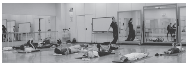
図4 スローコア・エクササイズの導入例

約束練習・乱取り練習の例を図3 (a)、(b)、(c)、(d) に示す。図3 (c)、(d) は柔道の帯を纏掛けにしている。