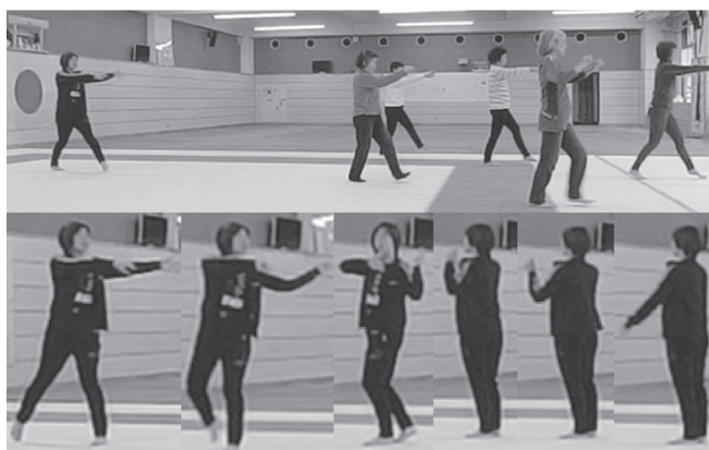
図5 女性のインストラクターによる打ち込み練習の導入