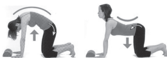
図1 スローコア・エクササイズの例

このエクササイズを柔道体操の準備運動と整理運動として実施し、身体をリラックスさせ、柔軟性を向上させ、身体の捻れや歪みを無くす。この例を図1に示す。