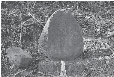
写真2 吉左衛門廻国供養塔