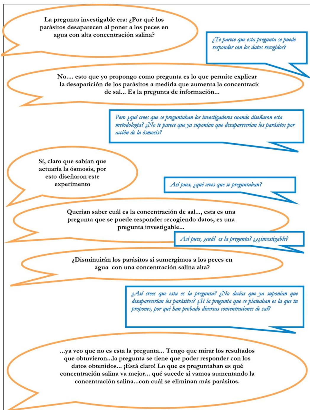
Figura 3. Diálogo entre estudiante y profesora en relación al cuestionario ‘Osmosis y protozoosi’ (Anexo 2)

A partir de la investigación descrita en el Anexo 3, que tiene el objetivo de demostrar si el clavulánico es un inhibidor del enzima penicilinasasa producido por bacterias que son resistentes a la penicilina, se generó el siguiente diálogo entre la profesora y los tres estudiantes, mostrando de nuevo la tendencia de proponer, de entrada, preguntas inabordables con la investigación ( ¿Cómo podemos hacer más efectivos los productos farmacéuticos? ), o preguntas de información ( ¿Por qué la presencia de clavulánico modifica la actividad de la penicilina? ), o bien preguntas tautológicas que ya pueden responderse con la información facilitada ( ¿Por qué la penicilina a veces no es efectiva? ).