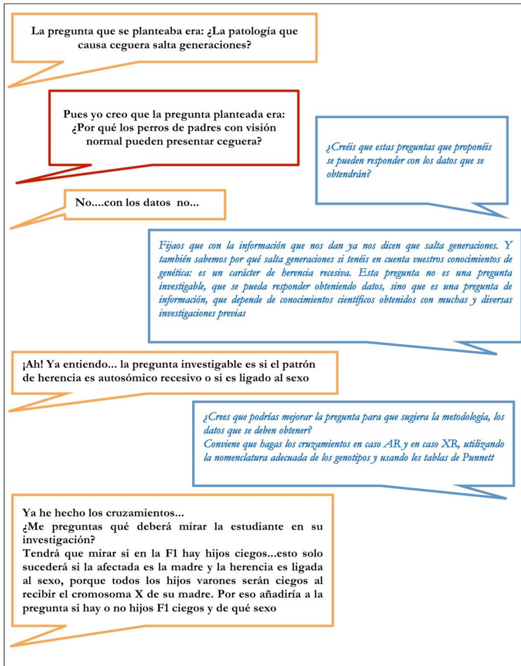
Figura 2. Diálogo entre estudiantes y profesora en relación al cuestionario ‘¿AR o XR?’ (Anexo 1)

desaparecer los parásitos, pero le cuesta concretar que la pregunta que inspira el diseño experimental es cuál es la concentración salina óptima. Su propuesta inicial de pregunta es ¿Por qué los parásitos desaparecen al poner los peces en el agua con alta concentración salina? Se trata de una pregunta de información que no puede ser respondida con los datos obtenidos en el experimento y que, además, los investigadores ya conocían al planificarlo.