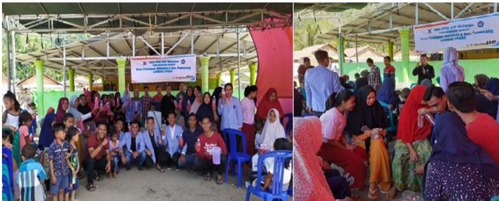
Gambar 4. Kegiatan Pembuatan Deterjen Cair & Parfum

Melalui kegiatan KBM berbasis Masjid, remaja masjid dan masyarakat umum diberikan beberapa penyuluhan dan pelatihan. Kegiatan pelatihan yang sudah dilakukan adalah pelatihan pembuatan detergen cair, pelatihan pembuatan farfum, dan pelatihan pembuatan mini garden.