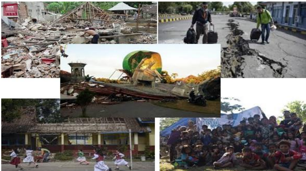
Gambar 1. Kerusakan Akibat Gempa di Lombok Utara

Situasi dan kondisi desa Persiapan Menggala menjadi memburuk setelah terjadinya gempa bumi mengguncang pulau Lombok sejak 5 Agustus 2018 lalu. Gempa bumi tersebut meluluhlantahkan pulau seribu masjid ini. Termasuk di dalamnya desa Persiapan Menggala. Berdasarkan data yang disajikan kompas.com pada tanggal 31 Agustus 2018 dari Badan Meteorologi Klimatologi dan Geofisika (BMKG) mencatat, total keseluruhan gempa bumi yang mengguncang Lombok selama satu bulan terakhir (selama Agustus) berjumlah 1.973 gempa bumi. Gempa ini meninggalkan dampak kerusakan infrastruktur yang luar biasa. Menurut Badan Nasional Penanggulangan Bencana (BNPB), sebanyak 32.129 rumah rusak, ratusan sekolah, masjid, Puskesmas, dan fasilitas umum lainnya hancur. Lebih lanjut, data yang disajikan Tempo.com, menurut Kementerian Sosial menyatakan jumlah korban akibat gempa Lombok, Nusa Tenggara Barat mencapai 563 jiwa, 417.529 jiwa mengungsi.