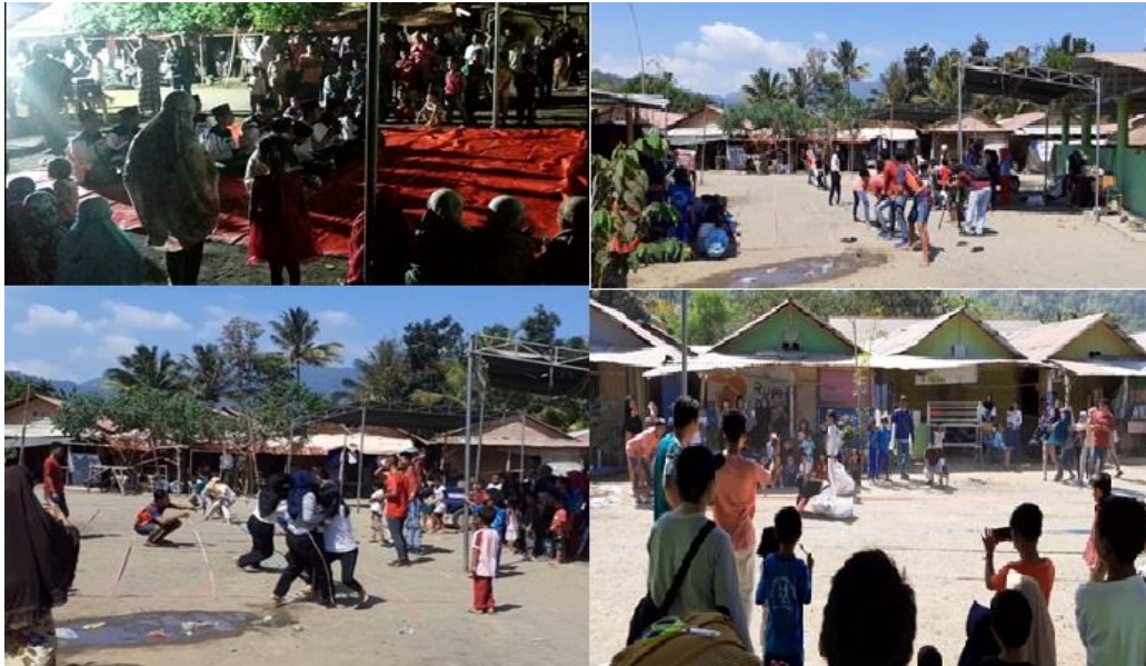
Gambar 4. Kegiatan Pentupan KKN-KBM dengan mengadakan Pertandingan dan Lomba

adzan, membaca Alqur'an, tahfizul qur'an, dan cerdas cermat. Adapun kegiatan pertandingan yang diadakan yaitu lari karung, tarik tambang, dan jalan sehat. Kegiatan ini diikuti oleh segenap masyarakat desa Persiapan Menggala, mulai dari anak-anak, remaja, dan masyarakat umum, serta perangkat desa setempat.