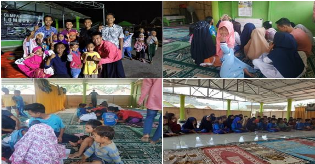
Gambar 3. Pelaksanaan Kegiatan Belajar dan Mengajar (KBM)

persiapan menggala. Santri yang sudah terdaftar sebanyak 41 santri. Proses KBM secara continue dan terjadwal terus dilaksanakan dengan jadwal Senin s.d Jumat mulai dari pukul 16.00-18.00 Wita.