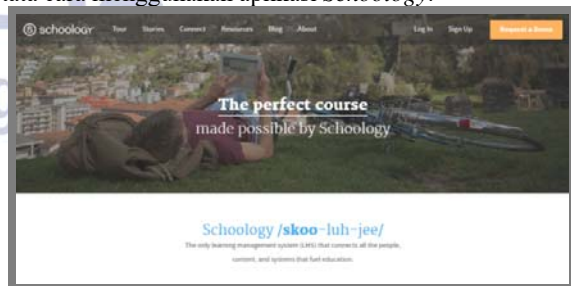
Gambar 2 Halaman Awal LMS Schoology

Pada penelitian yang dilakukan dengan judul pengaruh E-learning berbasis Schoology terhadap peningkatan hasil belajar siswa, dilakukan beberapa pembahasan dan penyajian hasil penelitian yang telah dilakukan. E-learning berbasis Schoology dapat digunakan dengan membuka pada web site Schoology.com . Schoology dapat diguakan pada semua sistem operasi dan smartphone . E-learning berbasis Schoology didalamnya telah diunggah konten yang berupa PDF, PPT ( Power Point ), Video tutorial dan game puzzle. Berikut adalah gambaran dari media E-learning berbasis Schoology . Berikut ini adalah tata cara menggunakan aplikasi Schoology .