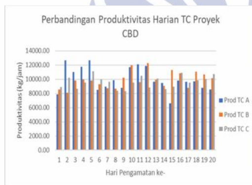
Gambar 2. Grafik Perbandingan Produktivitas Tower Crane A, B, C

Berdasarkan tabel 10 di atas terlihat bahwa TC A memiliki rata-rata produktivitas yang paling besar dengan rata-rata sebesar 10001,12 kg/jam sedangkan TC B sebesar 9941,30 kg/jam, TC C sebesar 9620,49 kg/jam. Dilihat dari grafik 5.0 nilai produktivitas harian tower crane proyek Puncak Central Business District Surabaya memiliki produktivitas yang tidak stabil atau dinamis dikarenakan terdapat beberapa faktor yang mempengaruhi nilai produktivitasnya.