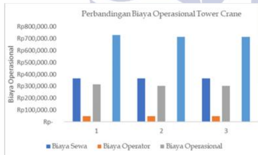
Gambar 3 Grafik Perbandingan Biaya Operasional Tower Crane CBD

Dapat dilihat dari tabel 4.11 diatas terlihat bahwa TC A memiliki biaya operasional yang paling tinggi sebesar Rp.729.535,71 perjam, TC B 715.497,71 dan TC C Rp. 715.497,71 dikarenakan perbedaan daya power tower crane A sebesar 75 kVA, tower crane B 65 kW dan tower crane C 65 kW.