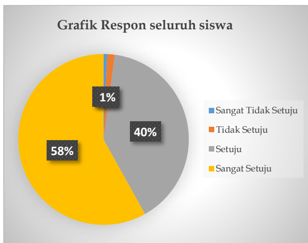
Gambar 4 Grafik Respon Seluruh Siswa Terhadap job sheet

Berdasarkan grafik interpretasi skor pada Gambar 3 dan grafik respon siswa pada Gambar 4 dapat disimpulkan bahwa job sheet berada pada kategori sangat baik dengan rata-rata \geq 88,01\% . Sehingga dapat dikatakan bahwa job sheet ini sangat praktis digunakan untuk pembelajaran.