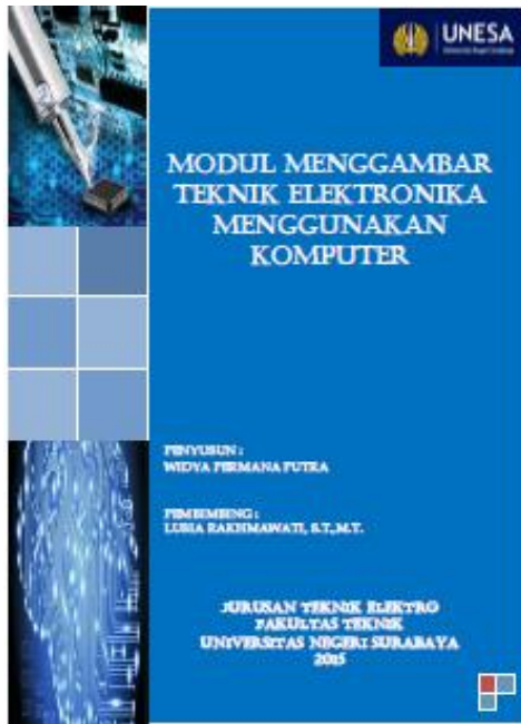
Gambar 2. Tampilan Sampul Modul