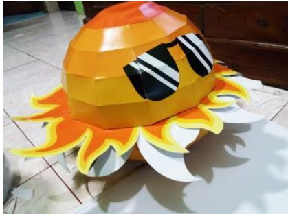
Gambar 2. Media Guru Matahari