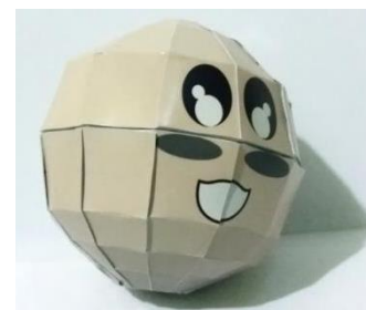
Gambar 1. Media Guru Bulan