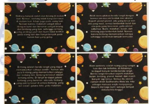
Gambar 7. Media Siswa Bercerita