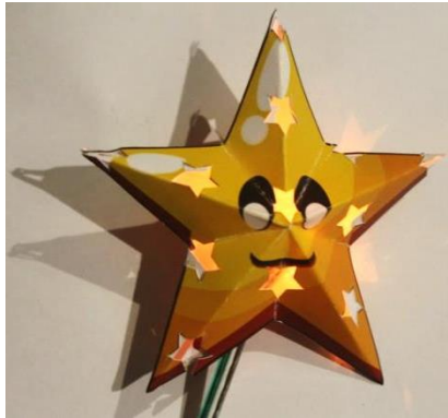
Gambar 3. Media Guru Bintang