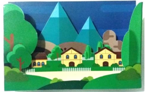
Gambar 5. Media Siswa Mencari dan Menghitung Bintang