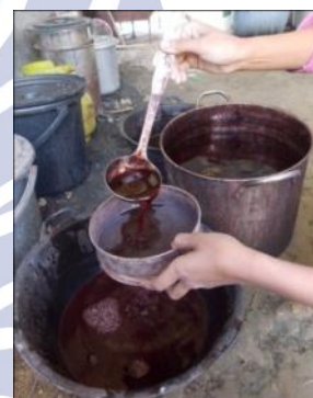
Gambar 2 : ekstrak buah cengkeh