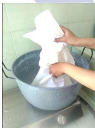
Gambar 1 : mordanting