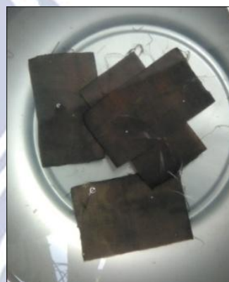
Gambar 4: Fiksasi