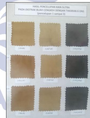
Hasil 16x Pencelupan Kain Sutra Dengan komposisi 1