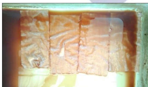
Gambar 3: Pencelupan Kain

kapur tohor dilarutkan dengan 1 l air),. Tunjung (70 gram dilarutkan dengan 1 l air air). Setiap larutan didiamkan semalam dan cairan beningnya yang digunakan. Fiksasi pada penelitian ini hanya dilakukan 1x, karena hasil dari fiksasi 1x atau 2x adalah sama.