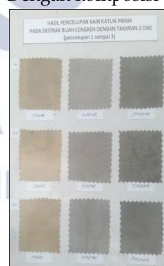
Hasil Pencelupan Kain Katun Prima Dengan komposisi 1