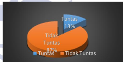
Gambar 1. Persentase Hasil Pretest Tes Keterampilan Berbicara Kelas Eksperimen

Pada Tabel 3 kelas eksperimen berjumlah 30 siswa yang mengikuti pretest dengan KKM 70, dihasilkan 4 siswa tuntas dan 26 siswa yang tidak tuntas. Sedangkan pada kelas kontrol yang berjumlah 28 siswa mengikuti pretest dengan KKM yang sama yakni 70, dihasilkan 3 siswa yang tuntas dan 25 siswa yang tidak tuntas. Ketuntasan hasil pretest siswa ini dapat digambarkan pada Gambar berikut: