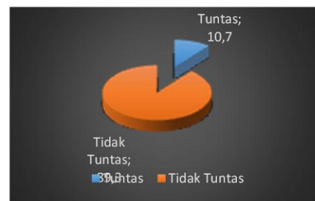
Gambar 2. Persentase Hasil Pretest Tes Keterampilan Berbicara Kelas Kontrol