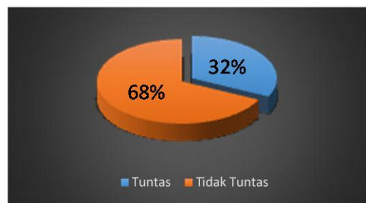
Gambar 4. Persentase Tes Keterampilan Berbicara Siswa Kelas Kontrol Saat Posttest