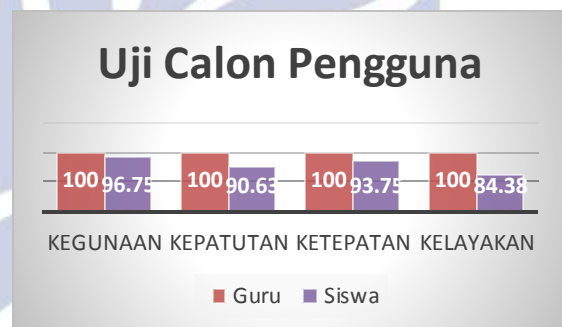
Grafik 3. Nilai Validasi Uji Calon Pengguna (Guru dan Siswa)

Berdasarkan grafik 1 dapat dilihat bahwa penilaian uji validasi oleh uji ahli materi mendapat perolehan 91,6% untuk aspek kegunaan, 93,75% untuk aspek kepatutan, 87,5% untuk aspek ketepatan, dan 82% untuk aspek kelayakan sehingga didapat rata-rata sebesar 88,75% untuk materi. Dalam kriteria kelayakan produk Mustaji 88,75% termasuk kedalam kategori sangat baik dan tidak perlu direvisi. Pada kolom saran dan komentar yang terdapat dalam lembar angket penilaian hal yang perlu ditambahkan adalah membuat buku panduan untuk media leaflet . Buku panduan ini akan membantu guru