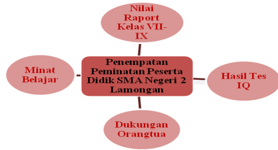
Bagan 4.2 Faktor-faktor yang di Pertimbangkan dalam Penempatan Peminatan Peserta didik di SMA Negeri 2 Lamongan