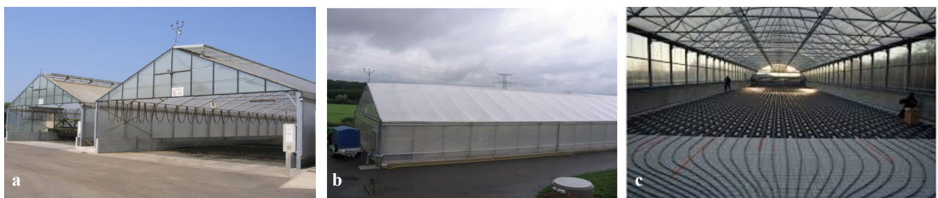
Figure 1: a) Serre ouverte, b) Serre fermée, c) Serre chauffée

Des composantes optionnelles peuvent être installées en fonction des besoins, comme l'installation d'un plancher chauffant ou une unité de désodorisation de l'air en sortie de la serre.