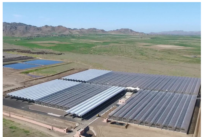
Figure 5: Serres de séchage des boues à Marrakech (Thermo-System, 2019)