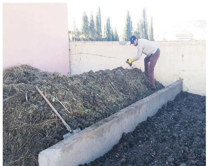
Figure 6: Plateforme pilote de co-compostage de la STEP de Chichaoua, Maroc (Jacob, 2016)