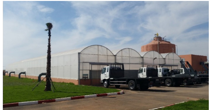
Figure 4: Serres de séchage des boues à Youssoufia (a) et Ben Guérir (b), Maroc (Thermo-System, 2017)