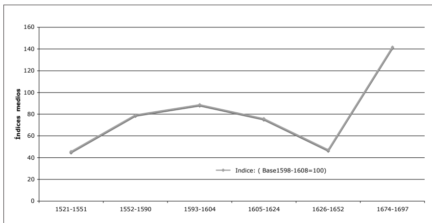
Gráfico I Evolución de la producción de aceite en Liesa 1500-1700