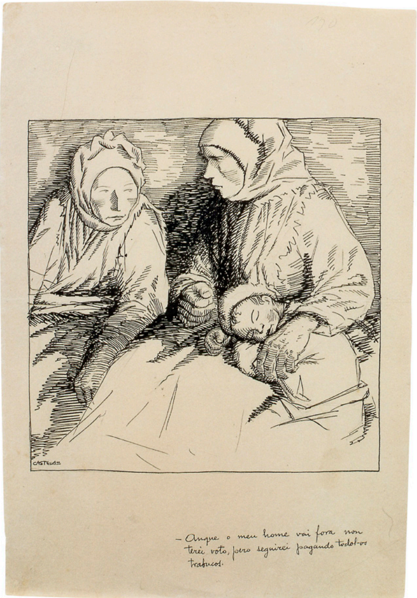
2. A.R.Castelao, Aunque o meu home vai fora , 1925, tinta sobre papel, 23.9 x 34.6 cm., Viñetas del Galicia, Colección Abanca

Para él, el arte era un medio social a través del cual podía exponer sus ideas y sentimientos. Su dibujo, cargado de humor e ironía se conjugaba con la tristeza y melancolía del pueblo gallego, definiendo una caricatura sencilla, lograda con los mínimos recursos técnicos acompañados en la mayoría de los casos, por el ritmo de su discurso literario en gallego. Inspirado en la estampa japonesa y en el dibujo de la vanguardia alemana, Castelao veía en sus ilustraciones un arte moderno que partía de la pintura tradicional donde enmarcar personajes de gran capacidad expresiva.