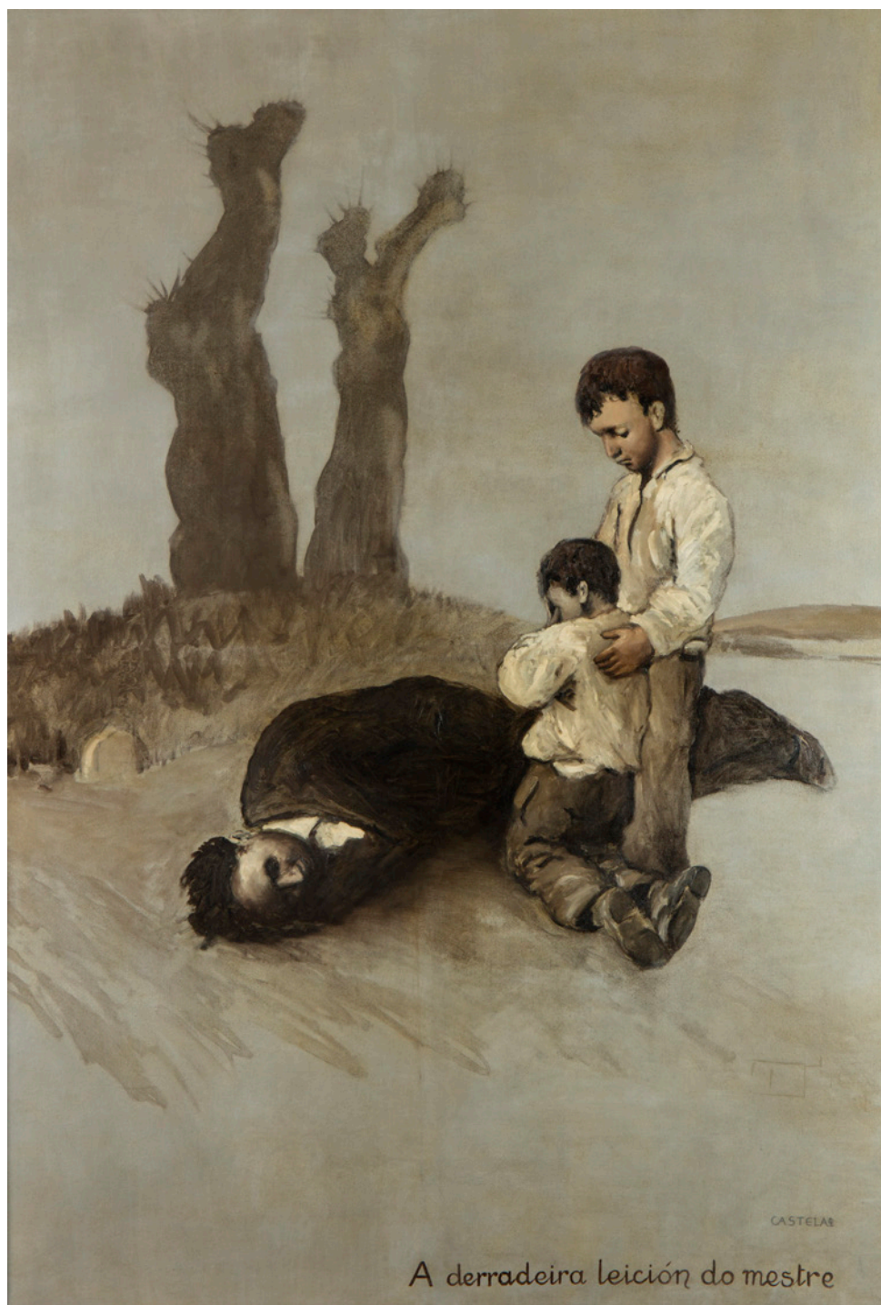
1. A.R. Castelao, A derradeira lección do mestre , 1945, óleo sobre tela, 218 x 157 cm., Centro Gallego de Buenos Aires