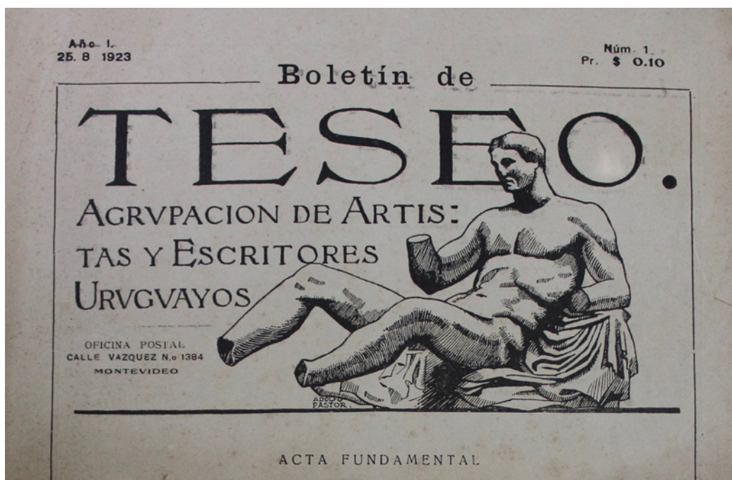
4. Recorte Boletín Teseo. Agrupación de Artistas y Escritores Uruguayos, Acta Fundamental, año 1, nº1, 25-VIII-1923. Biblioteca Nacional del Uruguay