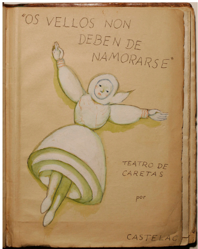
6. A.R. Castelao, Portada de Os vellos non deben de namorarse (1ª versión) , 1939, Dibujo a t mpera sobre papel, 24.3 x 18 cm, Museo de Pontevedra

Dieste encontraba cierto exotismo en Galicia. Trabajó distintas perspectivas y profundidades de su propia cultura que fue tanto gallega como rioplatense. Necesitaba sentir proximidad entre ambas y estaba convencido de que el horizonte común para lograrlo, era reforzar aquellos factores culturales que respondiesen a estéticas vinculadas con una identidad propia. (Fig. 6)