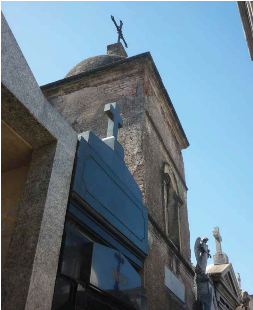
Figura 07. Sepulcro Rosendi, 1875.