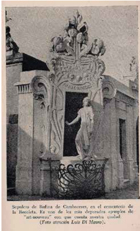
Figura 02. Ilustración del Sepulcro de Rufina Cambaceres, incluida en el libro de Núñez, titulado "Los cementerios", una de las obras pioneras al momento de relevar una historia de estos espacios, que se instalaron en los imaginarios urbanos como el sitio de la muerte por antonomasia.

la obra, su esencia. Pero al mismo tiempo establece una valoración evolutiva de la historia desde donde el presente es interpretado como superación del pasado, y por lo tanto, la obra podría "llegar a un estado completo que no haya existido nunca". 2