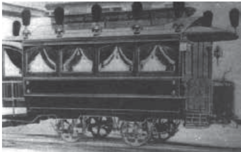
Figuras 03. y 04.

Imágenes exterior e interior de uno de los vagones de tramway pertenecientes a la empresa Lacroze, sistema de transporte previsto para el traslado de los difuntos al Enterratorio General del Oeste (actual Cementerio de Chacarita), durante tiempos de fiebre amarilla. Como rasgo particular, estos coches presentaban en su interior una reproducción espacial de las tradicionales “capillas ardientes”, unidades espaciales de base religiosa que se improvisaban mediante una serie de objetos rituales en la sala de la casa del difunto. Las circunstancias de la fiebre amarilla condujeron a trasladar y re-producir estos espacios por fuera del ambiente doméstico.