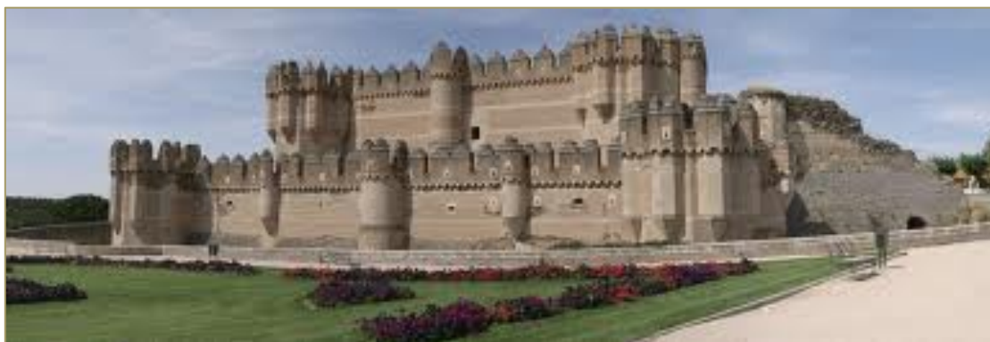
Figura 11. Castillo de Coca.

1931, junto con el recinto amurallado, fue declarado Monumento Histórico Artístico. Fue cedido al Ministerio de Educación y Cultura y hoy está destinado a Instituto de Educación Secundaria "Duque de Alburquerque"; mientras que en la torre del homenaje tiene su sede uno de los archivos nobiliarios más importante de España pues sus fondos documentales constan además del Archivo de la Fundación de la Casa Ducal de Alburquerque, el Archivo Histórico Municipal de Cuéllar y el Archivo de la Comunidad de la Villa y Tierra de Cuéllar.