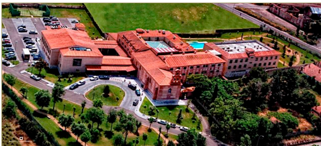
Figura 12. Vista aérea del Balneario de Olmedo.

El Hotel Balneario es un complejo compuesto por tres edificios en los que se combina la singularidad del antiguo convento mudéjar con modernas edificaciones (Figura12).