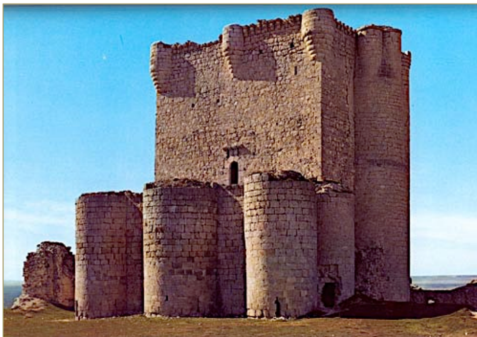
Figura 10. Castillo de Íscar.

conserva es la torre del homenaje que está hecha con grandes sillares y está rodeada de muralla con torreones intercalados. Consta de cinco plantas: la primera estaba destinada al almacén, la segunda y la tercera a los militares, la cuarta y quinta a los nobles que permanecían allí para defenderse en caso de ataque. Se corona con matacanes y desde la terraza se divisa una estupenda panorámica de la Tierra de Pinares. La torre ostenta los escudos de los Zúñiga que fueron sus propietarios desde el siglo XV: D. Pedro de Zúñiga y Avellaneda y de su esposa D a Catalina de Velasco (Figura 10).