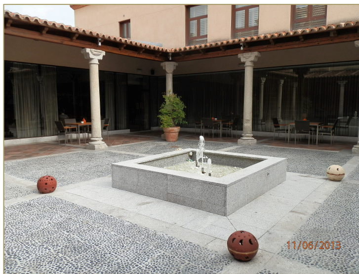
Figura 9. Claustro regular renacentista del Monasterio Sancti Spiritus de Olmedo, hoy patio del Balneario.

El monasterio fue edificado en una zona con abundancia de agua, como lo demuestran los siete pozos que hoy subsisten en el Balneario en el jardín y en lo que hoy es la fuente del claustro regular renacentista, de planta cuadrada y situado al sur del templo (Figura 9). El agua era un elemento indispensable en la vida monástica y en la huerta.