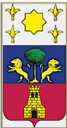
Figura 2. Escudo de la villa de Olmedo.

Olmedo debe su nombre a la abundancia de Olmos que existían en su zona y de los que hoy conserva muy pocos, entre ellos uno de los que fueron tratados contra la grafiosis, el llamado popularmente "Olma de San Andrés", un olmo común negrilla que tiene 1950 cm de altura y que mantiene su identidad puesto que aparece en la parte superior del escudo heráldico de la villa, como símbolo de fortaleza y robustez del pueblo y de su etimología que significa "Tierra de Olmos". La villa de Olmedo blasona su escudo partido en faja: en el jefe, dos leones de gules, atados al tronco del olmo que hacen referencia a la batalla que enfrentó en Olmedo a dos reinos distintos: Castilla y Aragón. En la punta, un castillo de oro en campo de gules y al timbre, una estrella entre cuatro flores de lis (Figura 2).