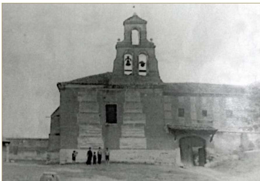
Figura 8. Monasterio de Sancti Spiritus. Actualmente alberga el Balneario de Olmedo.

En el Olmedo extramuros había tres monasterios, el de Sancti Spiritus, fundado en la primera mitad del siglo XII por la infanta D a Sancha de Castilla, que era el más antiguo de Olmedo y el primer convento femenino de clausura de la Orden del Cister de España. Convento de estilo mudéjar donde estuvieron alojadas Santa Teresa de Jesús y D a Juana "La Loca" y sobre cuyas ruinas se levantó el Balneario (Figura 8).