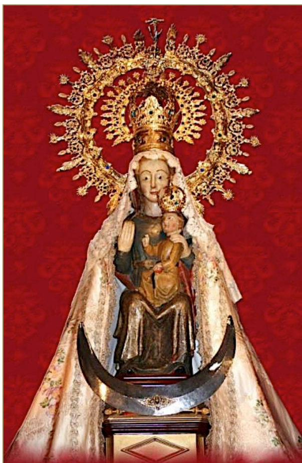
Figura 7. Virgen de la Soterraña, patrona de Olmedo.

Entre las iglesias de Olmedo, la de San Miguel es el templo más espectacular de arquitectura románica mudéjar vallisoletana. Se edificó en el siglo XIII y su torre se construyó en 1782 sobre un cubo de la muralla. Su retablo barroco, obra de Pedro de Sierra (1702-1760) está dedicado al Arcángel San Miguel, patrono de la villa cuya fiesta se celebra el 29 de septiembre. La cripta, de planta octogonal, está dedicada a la Virgen de Soterraña, imagen del siglo XIII patrona de Olmedo cuya fiesta se celebra el 30 de septiembre, mientras que el 10 de octubre se conmemora su coronación. La imagen está acompañada por la representación de las cuatro virtudes: Fortaleza, Esperanza, Fe y Templanza (Figura 7).