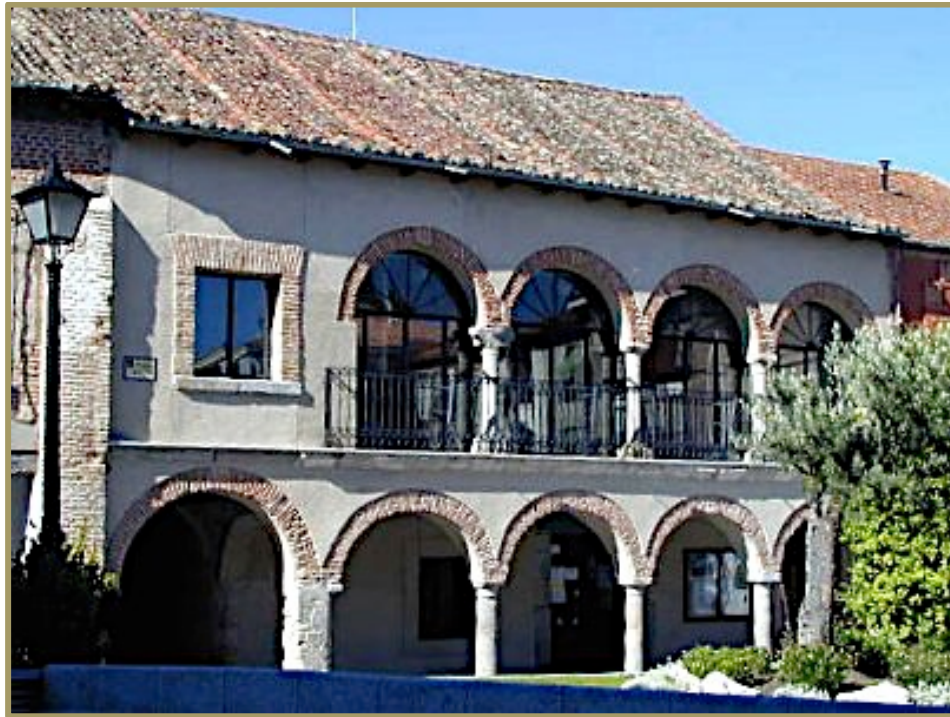
Figura 4. Casa de la Villa.