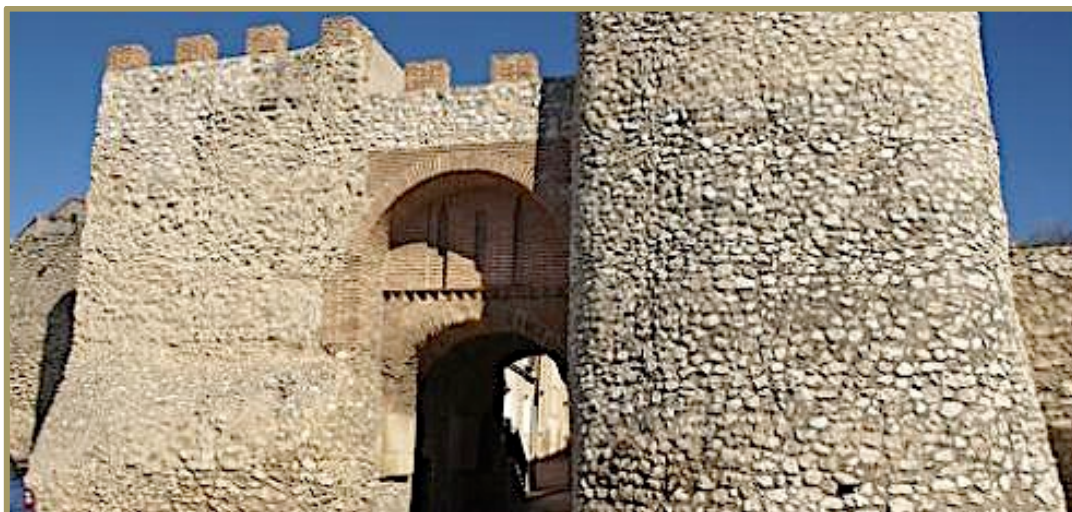
Figura 3. Arco de San Juan, puerta principal de entrada a la villa de Olmedo.

como Arco de San Juan porque por ella entran los toros en los tradicionales encierros de San Juan; y que consta de un doble arco de medio punto de ladrillo y está flanqueada en su cara externa por dos grandes cubos semicirculares de mampostería rematados en dientes de sierra (Figura 3).