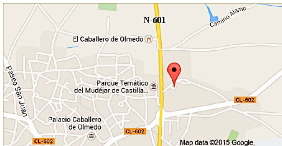
Figura 1. Situación del balneario en el Google Maps.

El municipio de Olmedo donde está enclavado el Balneario cuenta con una población de 3.897 habitantes. Las condiciones orográficas de Olmedo son esteparias, se caracterizan por extensas llanuras y con colinas de escasa elevación. Olmedo se sitúa en el valle del río Adaja, afluente del río Duero (Figura 1); que discurre por su extremo oeste. Además, el río Eresma, afluente del Adaja, recorre el extremo oriental de Olmedo. Las aguas de estos ríos suelen estar limpias y cristalinas, gracias al efecto depurador de los arenales que atraviesan; y en ellas se aloja una fauna muy rica a base de peces como lamprehuelas, bermejuelas, boga de Duero, calandrino y el cangrejo de río, que ha sido sustituido por el cangrejo señal.