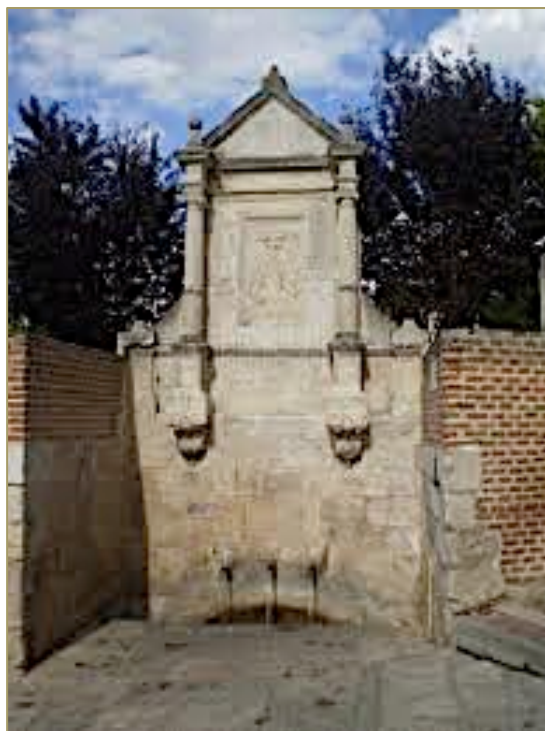
Figura 6. Fuente del Caño Nuevo.