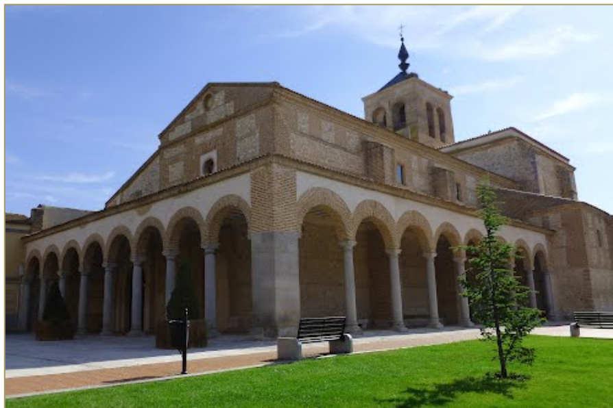
Figura 5. Iglesia de Santa María del Castillo.

tiene tres caños y constituyó la principal fuente de abastecimiento de agua para la villa en época de sequía (Figura 6).