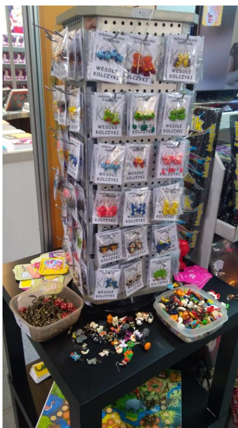
Fot. 1. Stoisko z kolczykami na Targach Książki w Krakowie

Przedstawiciele wydawnictw prześcigali się w pomysłowości i uatrakcyjnianiu swoich stanowisk. Do zatrzymania się przy stoisku wabiono zakładkami, cukierkami, długopisami, breloczkami i innymi drobnymi gadżetami reklamowymi. Częstowano jabłkami i gruszkami. Zainteresowanie odwiedzających wzbudzały dekoracje, sposób ekspozycji i ciekawa oferta, np. wydawnictw zajmujących się komiksami, puzzlami, grami itd.