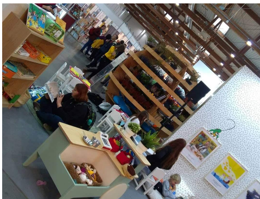
Fot. 3. Atrakcje dla najmłodszych i kula-taras Wydawnictwa Zakamarki

Bardzo ciekawym pomysłem okazało się stoisko, wywodzącego się ze szwedzkiej grupy wydawniczej Norstedts, Wydawnictwa Zakamarki. W jego ofercie są w szczególności przekłady literatury szwedzkiej, m.in. seria książek Astrid Lindgren o przygodach Pippi Langstrumpf. W pobliżu stoiska zaaranżowano „zakątek” czytelniczy w postaci kulistej drewnianej konstrukcji złożonej z siedzeń i półeczek, na których umieszczono rośliny i książki. W zakątku można było usiąść, odciąć się od gwaru czterodniowego święta literatury, by w przytulnym i przyjaznym miejscu skupić się nad lekturą 3 .