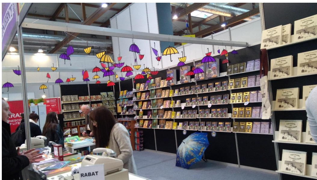
Fot. 2. Atrakcyjne stoisko wydawnictwa „Media Rodzina”

Bardzo ciekawym pomysłem okazało się stoisko, wywodzącego się ze szwedzkiej grupy wydawniczej Norstedts, Wydawnictwa Zakamarki. W jego ofercie są w szczególności przekłady literatury szwedzkiej, m.in. seria książek Astrid Lindgren o przygodach Pippi Langstrumpf. W pobliżu stoiska zaaranżowano „zakątek” czytelniczy w postaci kulistej drewnianej konstrukcji złożonej z siedzeń i półeczek, na których umieszczono rośliny i książki. W zakątku można było usiąść, odciąć się od gwaru czterodniowego święta literatury, by w przytulnym i przyjaznym miejscu skupić się nad lekturą 3 .