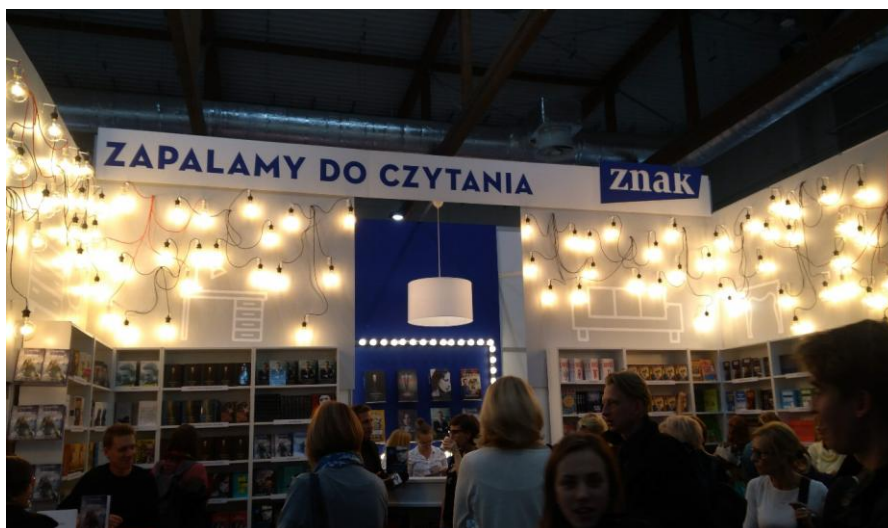
Fot. 6. Wydawnictwo Znak Zapala do czytania

Rzeszę czytelników przyciągało także wydawnictwo Znak ze swoim hasłem Zapalamy do czytania i pięknym oświetleniem, umieszczonym na górnej części stoiska. Dzięki takiemu rozwiązaniu było ono widoczne z daleka, a na stoisku panowała przytulna, a zarazem tajemnicza atmosfera.