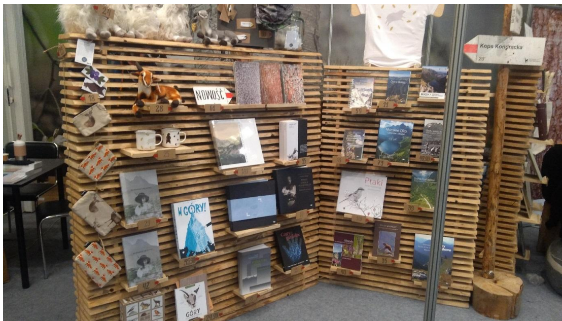
Fot. 4. Pomysłowe wyeksponowanie książek Wydawnictwa TPN

Kolejny fenomen stanowiły wydawnictwa podróźnicze. Stoisko Tatrzańskiego Parku Narodowego (TPN), zlokalizowane „na szlaku”, z którego charakterystyczne turystyczne drogowskazy pokazywały drogę i czas dojścia do znanych tatrzańskich miejsc, przyciągało uwagę i zachęcało, by przysiąść na pnju z książką w ręce. Natomiast Sklep Podróżnika poza ulotkami i książkami oferował sprzęt sportowy. Można było wyjść z targów książki z... plecakiem lub nartami pod pachą.