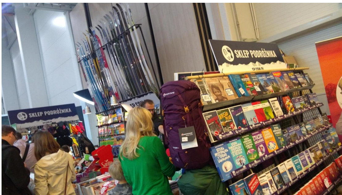
Fot. 5. Oferta Wydawnictwa Sklepu Podróżnika Fot. S. Bienia.