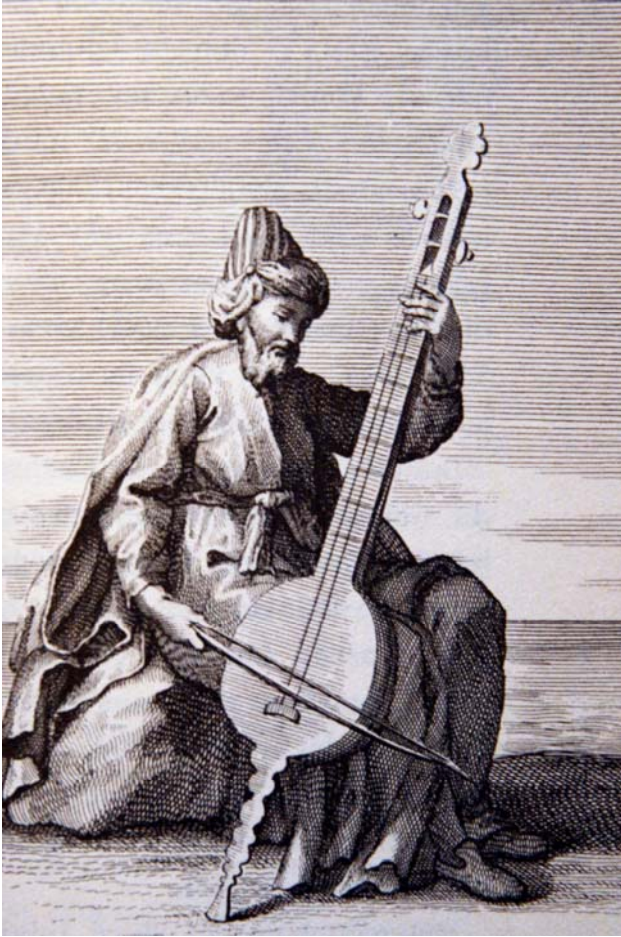
Şekil 2. Ayaklı keman, Bonnani 1723

ziğe ait gelenekler ile ilgilidir. Müziğimiz yüz-yıllar boyunca meşk sistemi denilen usta-çırak ilişkisine dayalı bir eğitim sistemi ile öğretilmiştir. Çalgı teknikleri, müziğe ait tavırlar ve repertuar nota yardımı olmaksızın bir sonraki nesile aktarılmaktadır. Tarih içerisinde birçok nota sistemi bulunmuş olsa da, bu sistemler ancak yazılı müzikler için kaynak teşkil eder niteliktedirler.