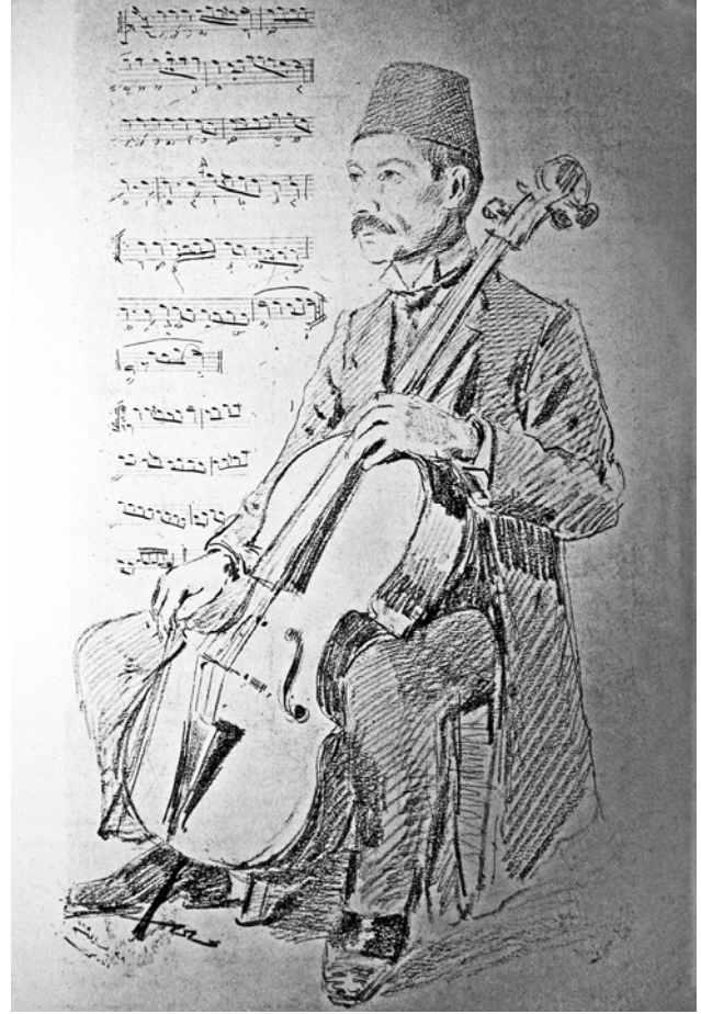
Şekil 3. Tanburi Cemil Bey viyolonsel ile

sel icralarında da görmek mümkündür. Viyolonsel taksimlerdeki icraları, kemençe icraları kadar enerjiktir. Viyolonsel geniş renkli tınısı ve ses kapasitesi, Tanburi Cemil Bey’in yorumlarına yeni boyutlar kazandırmıştır. Viyolonseli, tanbur ve lavta tekniği içinde çalmış olması kuvvetli bir ihtimal olarak karşımıza çıkmaktadır.