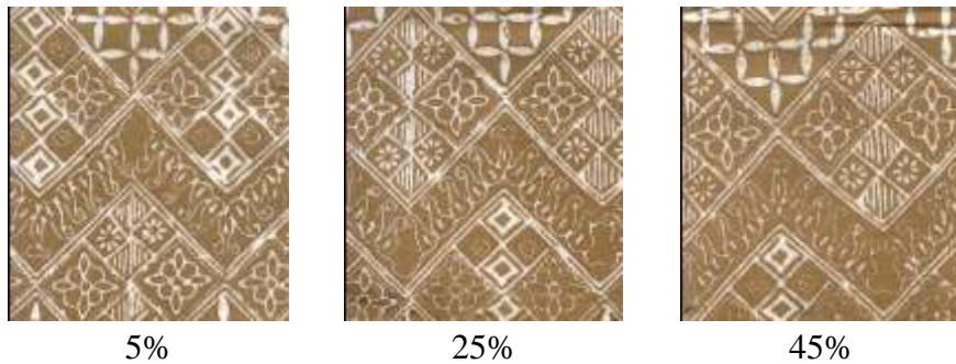
Gambar 3. Kain hasil pelorodan dengan fiksasi larutan tawas