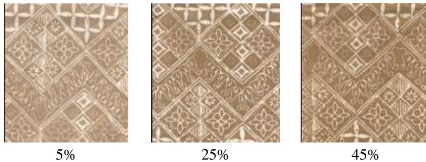
Gambar 2. Kain hasil pelorodan dengan fiksasi larutan kapur