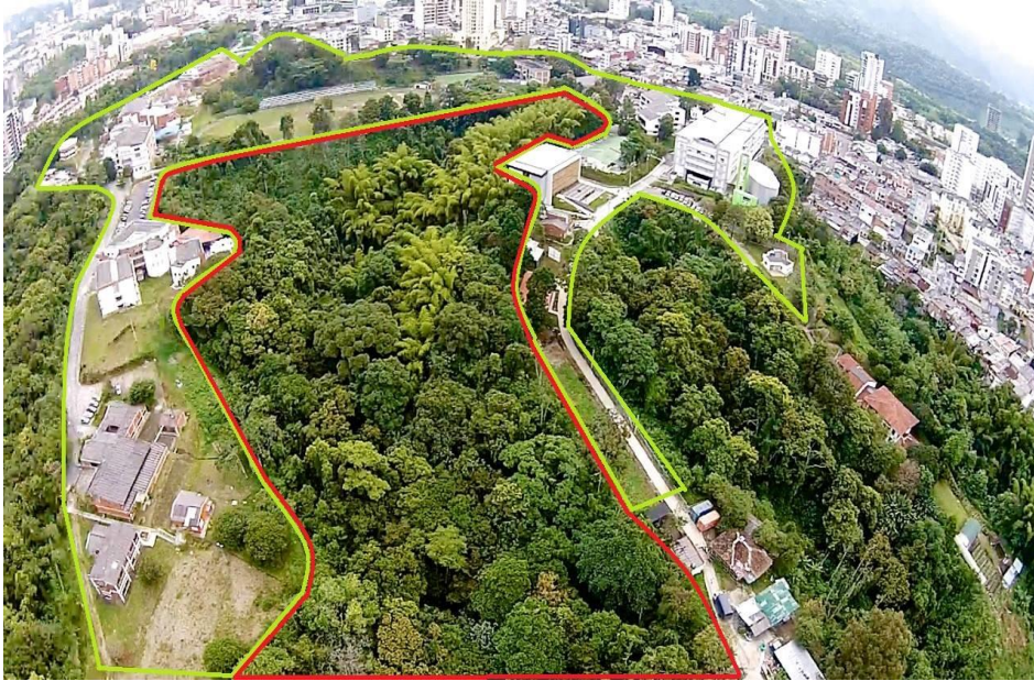
Figura 1. Área de obtención de abejas en el Jardín Botánico de Armenia.

X 16 X 6 cm para Scaptrotogonna sp. Ambos modelos fueron modificados con un orificio