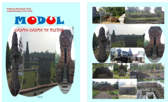
Gambar 1. Desain Bahan Ajar (Modul)

Pengembangan bahan ajar (modul) sejarah Indonesia berbasis candi-candi di Kabupaten Blitar disusun dengan menghimpun data dengan mewawancarai juru pelihara candi meliputi candi Penataran, candi Sawentar, candi Simping, candi Wringin Branjang, candi Bacem, candi Tepas, candi Gambar Wetan, candi Kotes, candi Kali Cilik, candi Plumbangan, candi Rambut Monte, dan candi Sumbernanas. Desain bahan ajar/modul candi-candi di Blitar sebagai berikut: