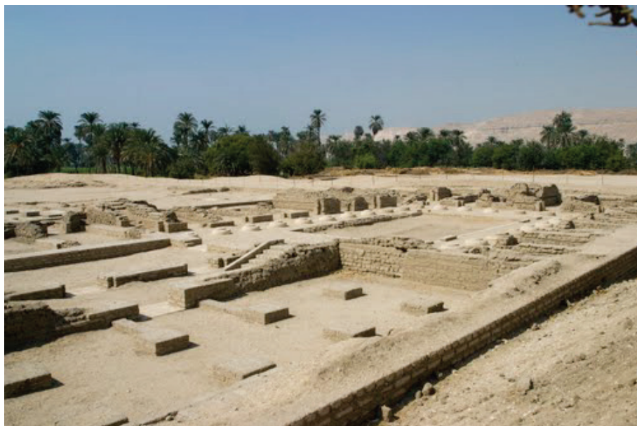
Parte do grande templo de Akenaton em El-Amarna

mente, continuava a ser visitada por viajantes curiosos. Até que no início do século XIX, da nossa era, começou a despertar o interesse de arqueólogos por suas inscrições desconhecidas e por suas tumbas depredadas. A desconhecida cidade passou, então, a ser chamada de Tell El-Amarna. Conforme, Rainey (2015, p. 1), por um mal-entendido dos nomes da vila et-Til e da tribo banu Amram, que vivia nos arredores.