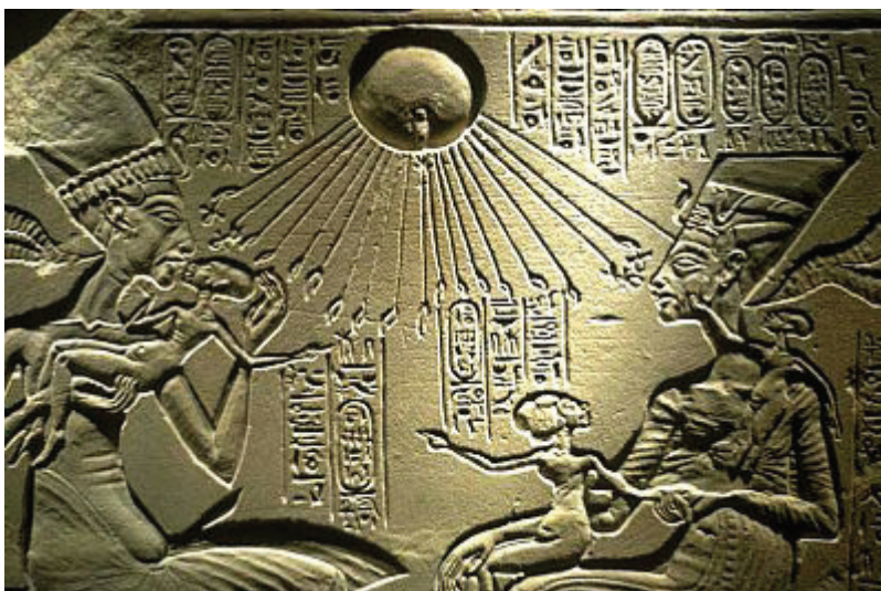
Akenaton com a família real e o disco solar ( http://www.auladearte.com.br/historia_da_arte/egito.htm#axzz4pMCJzJKi )