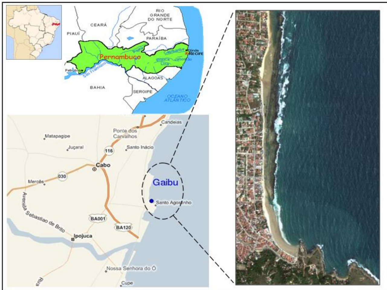
Figura 1. Mapa com a localização da área de estudo, evidenciando o recife arenítico da praia de Gaibú, Pernambuco, Brasil.

intensidade de batimento das ondas (modo batido) e em locais abrigados (modo calmo). Devido à configuração dos recifes as áreas voltadas para o mar são consideradas o modo batido e as áreas voltadas para a faixa de areia são consideradas o modo calmo. Os exemplares obtidos foram retirados com o auxílio de espátulas, sendo raspada a superfície de fixação dos espécimes que, em seguida, foram acondicionados em sacos plásticos com água do mar, devidamente etiquetados e lacrados individualmente. Em tabelas de campo registraram-se os parâmetros relacionados com a ecologia, morfologia externa e local de ocorrência de cada exemplar (Tabela 1).