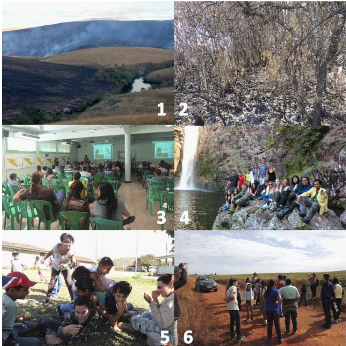
Figura 2 – (1) uma extensa área queimada, em que o fogo chegou a atingir a vegetação ripária em alguns pontos; em (2), é possível ver o sub-bosque de uma mata galeria densa, totalmente queimado por um incêndio criminoso; a (3) palestra durante o I Simpósio sobre o fogo no Parque Nacional da Serra da Canastra (PNSC); (4) alunos do curso da Universidade Federal Fluminense (UFF) em novembro de 2014; (5) e (6) crianças e adolescentes do CRAS sendo guiados em duas ocasiões distintas no Parque Nacional da Serra da Canastra para o desenvolvimento de atividades de educação ambiental.