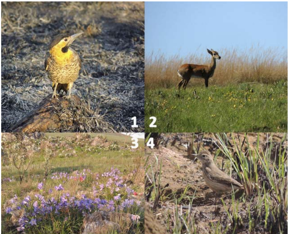
Figura 3 – Animais que utilizam as áreas queimadas para forrageamento: (1) Pica-pau-do-campo ( Colaptes campestris ); (2) Veado-campeiro ( Ozotoceros bezoarticus ), espécie quase ameaçada (IUCN 2014); (3) floração em massa de várias espécies; (4) Andarilho ( Geositta poeciloptera ), espécie vulnerável (IUCN 2014). (fotos: CZFieker).

3ª Etapa (2015): Relatórios foram ou estão sendo produzidos, conforme cronograma da atividade, por cada subgrupo que desenvolveu um dos 12 projetos. Com isso, os dados e os resultados estão sendo devidamente sistematizados para uso futuro. Um amplo projeto de divulgação científica e educação ambiental está em andamento no interior do estado de São Paulo, como forma de divulgação do trabalho desenvolvido pelos cursistas em campo e dos problemas que o meio ambiente enfrenta na Serra da Canastra, em especial com relação ao fogo. Após a exposição de fotografias, a apresentação dos resultados dos projetos em palestras semanais e a exposição de painéis, o material impresso e digital será doado ao PNSC. A Figura 3 apresenta mais exemplos de imagens que compõem o Banco de Dados multimídia da biodiversidade local, relacionada ao fogo, que será doado à unidade.