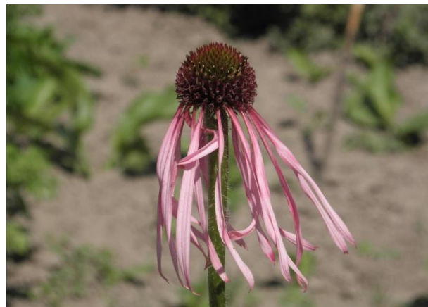
Рис. 2. Цвітіння E. pallida

Рослини E. pallida досягають висоти 64–100 см. Стебло зелене, опушене, ребристе. Суцвіт'я конусоподібні, поодинокі, великі. Язичкові квітки двозубчасті, безплідні. Трубчасті квітки двостатеві, із п'ятизубчастим, трубчастим, дзвоникоподібним віночком (рис. 2). Стеблові листки розміщені в нижній частині стебла. Прикореневі листки довгочерешкові, ланцетної форми, із зубчастим краєм. Стеблові листки коротчерешкові, видовжені, на верхівці загострені, покриті жорсткими волосками. Верхні листки стебла майже сидячі.