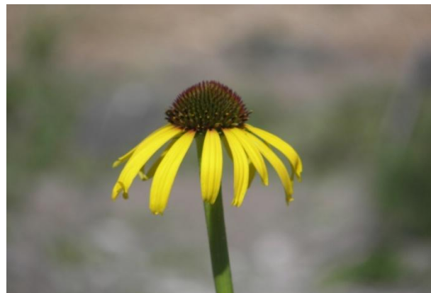
Рис. 3. Цвітіння E. Paradoxa

E. paradoxa – єдина в роді жовта ехінацея. Рослини досягають висоти 75–100 см. Стебло та листки темно-зеленого кольору, пряме, ребристе. Прикореневі листки довгастоланцетні. Верхні листки коротчерешкові, майже сидячі. Темно-коричневі трубчасті квітки ехінацеї утворюють випуклу, майже круглу серединку, язичкові доволі сильно пониклі, майже обнімають пагін (рис. 3).