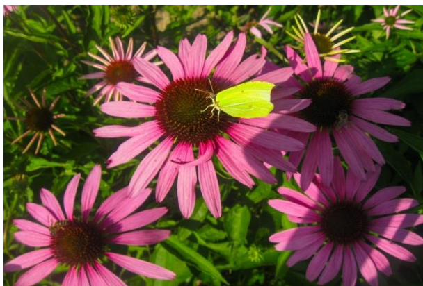
Рис. 1. Цвітіння E. purpurea

Висота рослин E. purpurea досягає 50–100 см. Стебло пряме, ребристе, опушене жорсткими волосками. Суцвіт'я – верхівкові кошики: квітки трубчасті, променеві та язичкові – стерильні, віночок пурпуровий (рис. 1). Розеткові листки довгасті, яйцеподібні, довгочерешкові. У верхній частині стебла їх кількість поступово зменшується, розміщення листків чергове. Черешкові листки яйцеподібноланцетні.