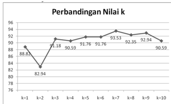
Gambar 3. Diagram perbandingan nilai k