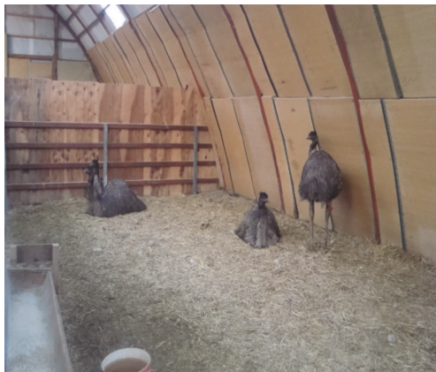
Fig. 1 Farm D type house for emu mating experiment (pen : 4.80 × 8 m)

間に認められた。1分台が多く、22~48秒が41.36%、48~74秒が34.55%であった。交尾時間が長くなると交尾回数は減少傾向にあった。交尾時間が短い例では22秒で、長いのは3分50秒であった(表3)。