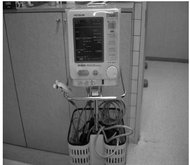
写真2 本実験で測定に用いた生体情報モニター