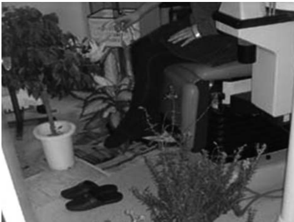
写真1 診療椅子わきの供試植物

実験2: 緑化の効果を明らかにするため、実験1と逆の順序で実験を行った。すなわち、観葉と花卉、観葉のみ、植物なしの場合の順で計測を行った。一人につき、同じ順序で続けて繰り返し2回計測した。被験者は4名であった。