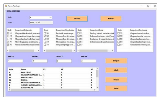
GAMBAR 3 FORM DATA PENILAIAN