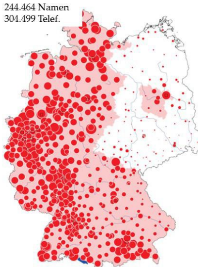
Abb. 5: Doppelnamen mit Bindestrich in Deutschland nach Telefonanschlüssen 2005

Räumlich gesehen tritt bei den Doppelnamen eine Aufspaltung in West- und Ostdeutschland vor Augen, weil in der DDR keine Doppelnamen gebildet werden durften. Die Ausnahmen im Gebiet der alten DDR beruhen auf historischen Sonderfällen. Sie gehen beispielsweise in Steinbach-Hallenberg in Thüringen darauf zurück, dass dort im 16. Jahrhundert so viele Einwohner Holland hießen, dass sie schon damals mit Doppelnamen wie Holland-Moritz usw. differenziert werden mussten. Die Verdichtungen in Westfalen beruhen u.a. darauf, dass dort schon seit der Zeit frühneuzeitlichen Siedlungsausbaus der Besitzer des alten Hofes vom Besitzer des Neuhofes mit Namen wie Grote- , später auch verhochdeutsch Große-Bestens versus Lütke- , später auch verhochdeutsch Kleine-Bestens unterschieden wurden, und dass schon früh die prestigeträchtigen Amtsbezeichnungen westwestfälisch Schulte bzw. ostwestfälisch Meyer mit Hofnamen zu Doppelnamen wie Schulte-Kellinghaus bzw. Meyer-Bothling verbunden worden sind (DFA Bd. 3: 586-607).