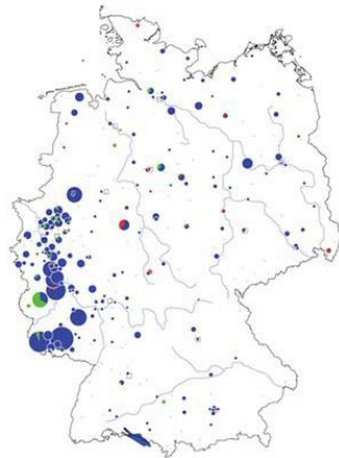
Abb. 3: Schreibweise hs in Familiennamen mit ß in Deutschland nach Telefonanschlüssen 2005

Typ Grohs[mann] 17 Namen/64 Telef.: Grohsmann 26, -gart 5, -kopf 5, -pietsch 4, -jean 3, -klaus 3, -maas 3, -schmiedt 3, -feld 2, -kreutz 2, -müller 2, -bach 1, -ebner 1, -haus 1, -heim 1, -imlinghaus 1, -kurth 1.