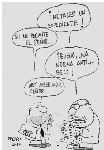
Imagen 4. Perich, La Vanguardia , 15-4-1977

ge su compañero para concluir tras ello: «Bueno, al tiempo» 33 . Mediante este juego de palabras, Forges augura que el carácter de la nueva norma será abiertamente restrictivo.