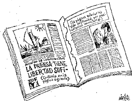
Imagen 5. Mingote, Abc , 7-9-1975, p. 3

siguiente (La página anterior ha sido suprimida por prescripción ministerial)» 34 (ver imagen 5).