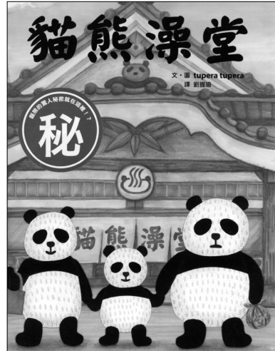
図4 『猫熊澡堂』 小魯文化、2014年より

この問題には歴史的な背景——日本人は裸体を平気でさらす傾向があった——も関係しているのではなかろうか。江戸時代に日本にやってきた西洋人たちは、日本人が人前で裸体をさらして行水や入浴をしたりすることに驚いて数々の記録を残した。東アジアの儒教国(孔子以来、