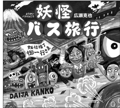
図6 広瀬克也『妖怪バス旅行』絵本館、2016年より

番組『旅するドイツ語』のテキストがある。連載記事「おもてなしのドイツ語」では、ドイツ語圏から日本にやってきた観光客に、温泉や銭湯でおもてなしをするための表現が示されている。