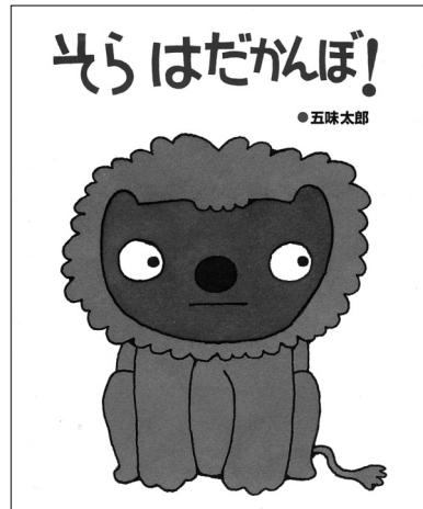
図5 『そら はだかんぼ!』 偕成社、1987年より