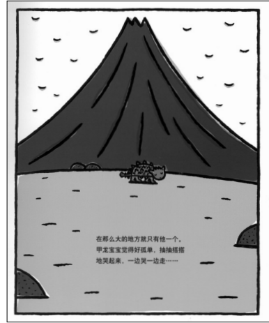
図1 『你看起来好像很好吃』 二十一世紀出版社、 2009年より

いる。『你看起来好像很好吃』では、卵からかえったアンキロサウルスの赤ちゃんが歩いている様子（図1）は「甲龙宝宝觉得好孤单，抽抽塔塔地哭来，一边哭一边走……」と表現している。対する日本語原文は「あかちゃんは さみしくて しくしく なきました。そして、なきながら とぼとぼ あるいている」となっている。