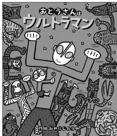
図2 みやにしたつや 『おとうさんはウルトラマン』 学研、1996年より

がある (5) 。中国でのウルトラマンは1993年に正式にテレビ放映されてから人気は現在にいたるまで続き、親子二代でウルトラ作品を楽しむという現象も起きているという (6) 。『おとうさんはウルトラマン』シリーズは、ウルトラマンと無縁なひとには面白みが伝わりにくい可能性があるが、ウルトラ作品のファンならば絵本の世界をより深く楽しめる。ウルトラマンが愛されている中国で翻訳すれば、かなりの人気を集めるのではなかろうか。