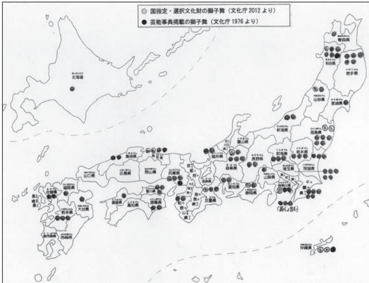
(図1) 日本における獅子舞の分布

上記の図は文化庁監修／日本ナショナルトラスト編(1976)、文化庁文化財部伝統文化課(2012)に基づいて筆者が作成したもの