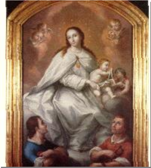
Figura 3 “Virgen de la merced con el niño” (1795)

Campeche en todas sus obras siempre trata de capturar un poco de su cultura y raíces como lo es “Las Hijas del Gobernador” (1797). Él; artista nos muestra a las niñas María Guadalupe Josefa nacida en México, y María del Carmen nacida en San Juan, las dos niñas sostienen un ramillete de flores de Puerto Rico