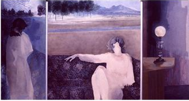
Figura 13, “El sofá”, 1977

A pesar de sus pintoras abstractas y lineales, Báez pinta además paisajes típicos de la Isla como lo es “El manglar” el cual es muy común en las costas de Puerto Rico. Los colores y la luz en esta pintura demuestran la vida y el nacimiento, mientras las áreas oscuras en la pintura donde las raíces crecen, representan la descomposición, confusión y sustitución del país adoptando la cultura estadounidense.