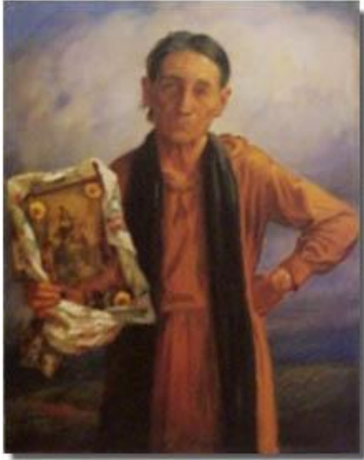
Figura 10, “La Promesa” 1928.

La transformación de manera dramática de la economía del país para los años 1945 en adelante ha cambiado de la producción de la agricultura a una manufacturera, además de incentivos fiscales y la mano de obra barata atrajeron a Puerto Rico una gran cantidad de industrias las cuales son manifestadas en otra obra de Pou “Fabrica de