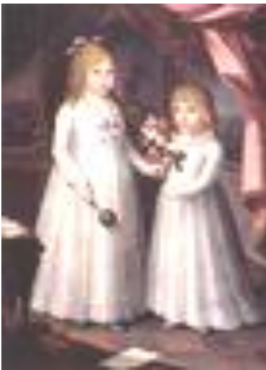
Figura 4 “Las hijas del gobernador” (1797)

instrumentos típicos de la música puertorriqueña.