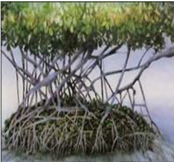
Figura 13, “El Manglar” 1990

Myrna Báez aun sigue pintando y ayudando a artistas jóvenes de la Isla para promocionar y seguir el estilo del arte. Por siglos artistas Puertorriqueños han variado sus estilos, colores temas, tamaños e iluminación, pero todos tienen el mismo fin y objetivo. Este objetivo es el de expresar sus sentimientos y los