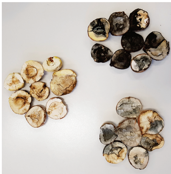
Slika 1. Plodovi kestena zahvaćeni s truleži. Iz crnih i sivih zona (gore desno i dolje desno) izolirane su uvijek i isključivo Botryosphaeria dothidea ili Neofusicoccum parvum , dok je iz smeđih, žutih ili bjeličastih zona (sredina lijevo) izoliran Gnomoniopsis smithogilvyi .

Picture 1 Sweet chestnut fruits affected with nut rot. Only Botryosphaeria dothidea or Neofusicoccum parvum were regularly isolated from black or grey rot (right), while Gnomoniopsis smithogilvyi was isolated from brown, yellow or whitish rot (left).