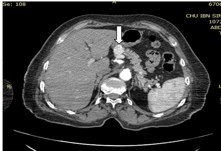
Figure 1:- TDM abdominale coupe axiale avec injection de PCI : lésion au niveau du corps du pancréas (flèche) rehaussée après injection de PCI