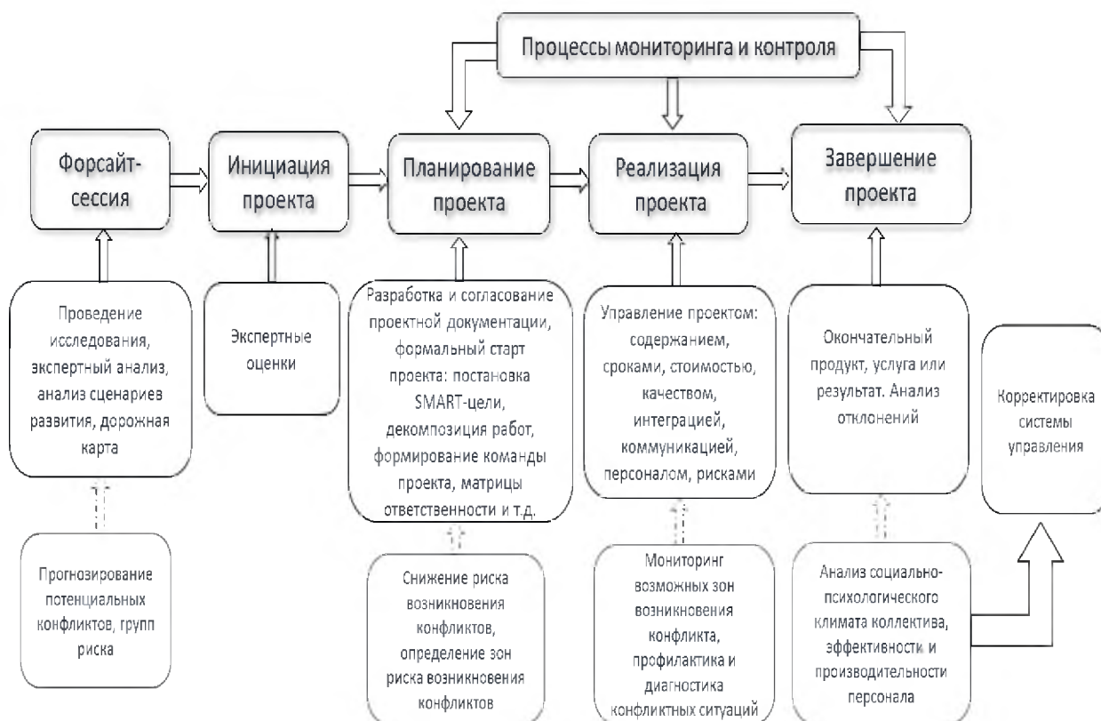
Рис. 3 Схема управления конфликтами в рамках проектной деятельности организации

Руководство организации должно выступать в роли заинтересованных участников форсайта, тогда возможна ситуация заключающаяся в одновременном поддержании партикулярных интересов организации и заинтересованности в достижении целей форсайта.