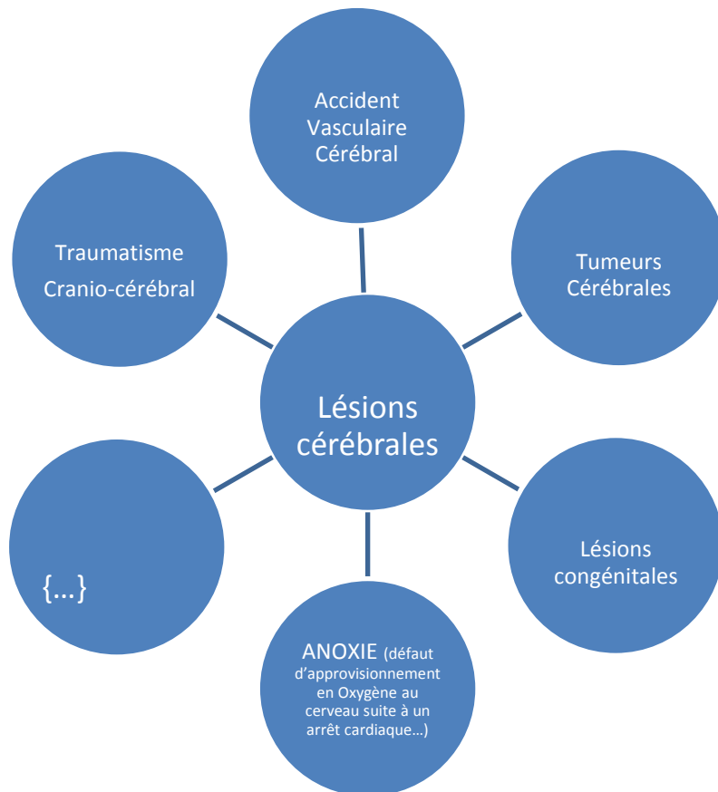
Tableau 2: schéma récapitulatif des causes de lésions cérébrales

Une lésion cérébrale c'est à l'origine « une blessure plus ou moins grave du système nerveux central provoquée par un événement souvent instantané » 25 : Ci-après voici un schéma récapitulatif des événements pouvant être à l'origine d'une lésion cérébrale. Nous développerons dans la suite de notre travail deux causes majoritairement représentées à Valais de Coeur, le Traumatisme Cranio-Cérébral et l'Accident Vasculaire Cérébral: