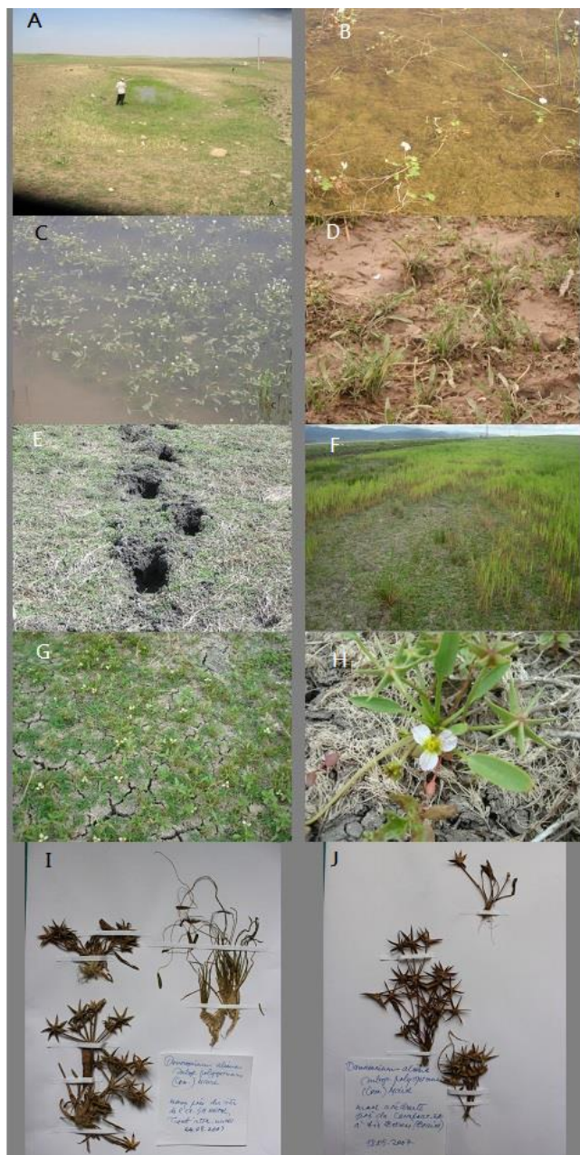
Figure 2. — A - mare à l'est de Tiaret, près de la jumenterie ; B - Ranunculetum baudotii : D. alisma subsp. polyspermum avec feuilles filiformes immergées, Tiaret, près de la jumenterie ; C - Ranunculetum baudotii : D. alisma subsp. polyspermum avec feuilles flottantes, Tiaret intra muros ; D - Ranunculetum baudotii à l'exondation, Tiaret intra muros ; E - Damasonio-Crypsidetum aculeati , champs d'orge à l'est de Tiaret ; F - mare mise en culture, ouest Aïn Bessem ; G - Damasonio-Crypsidetum aculeati , ouest Aïn Bessem ; H - D. alisma subsp. polyspermum , ouest Aïn Bessem ; I - D. alisma subsp. polyspermum , Tiaret ; J - D. alisma subsp. polyspermum , ouest Aïn Bessem.